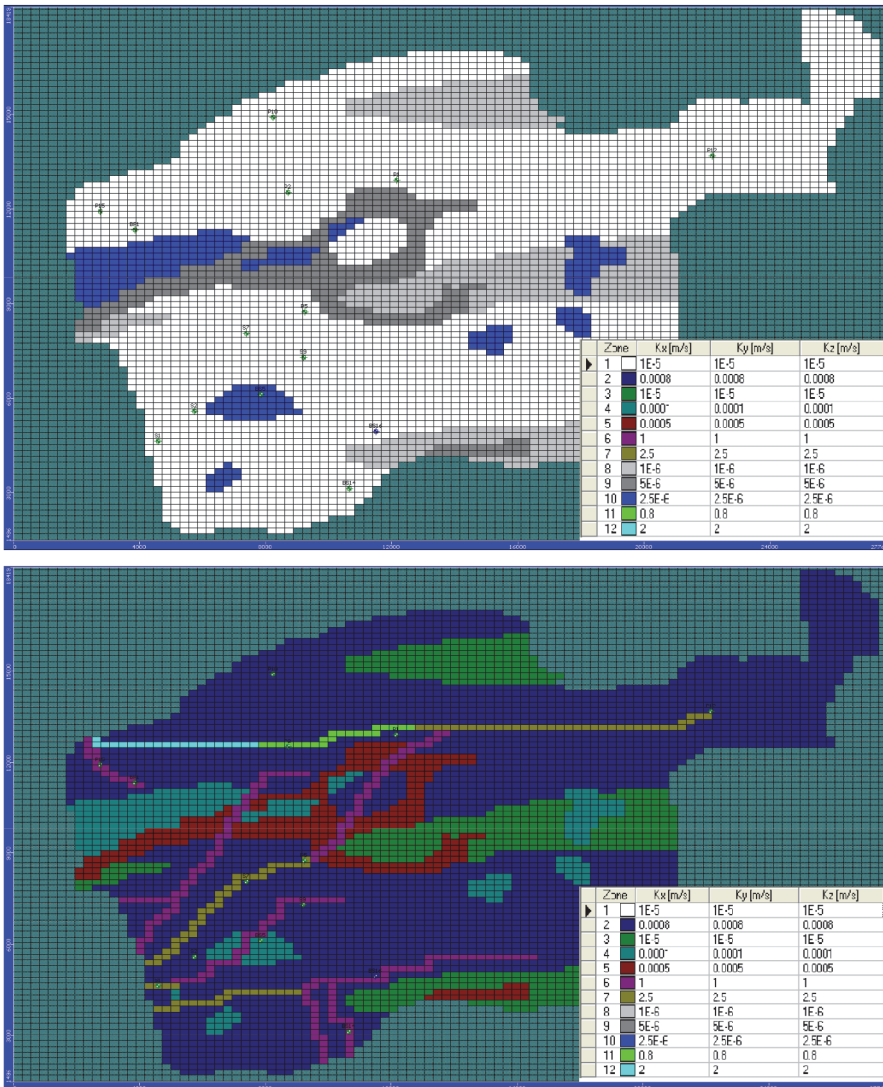
Slika 3. Prostorna raspodjela koeficijenta hidrauličke vodljivosti na gornji sloj (iznad) i donji sloj (ispod)

Rezultati usporedbe razina podzemnih voda između modeliranih i izmjerenih vrijednosti na piezometrima P2, P5 i S7 prikazani su na slici 4. Razlika između modeliranih i izmjerenih vrijednosti razina podzemne vode nalazi se unutar kalibracijskog kriterija od plus, minus 1,5 m [10].