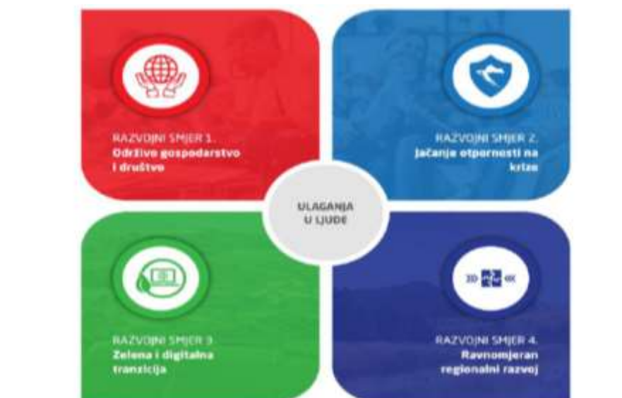
Slika 9. Razvojni smjerovi Nacionalne razvojne strategije RH do 2030. godine