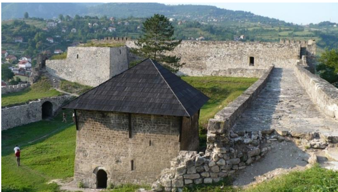
Prilog 2: Jajačka tvrđava – primjer kombinacije srednjovjekovne i renesansne vojne arhitekture.