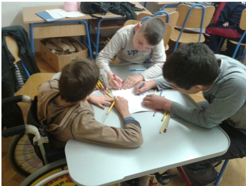
Slika 11. Učenici crtaju igralište

U glavnoj aktivnosti učenike sam podijelila u grupe po četvero i svaka grupa je dobila papir A4 formata. Cilj ove aktivnosti bio je da se učenici uče međusobnom dogovoru i suradnji kako bi postigli zajednički cilj. Ovu aktivnost sam utemeljila na kooperativnom zakonu međusobne ovisnosti. Učenici su unutar grupe trebali surađivati, komunicirati, uvažavati tuđe mišljenje, a ujedno poštivati temeljne humane vrijednosti: prijateljstvo, suradnju, solidarnost, pravednost i nenasilje. Na ploču sam nacrtala prikaz papira i objasnila im što trebaju učiniti: Svake grupa je trebala podijeliti poslove i zajedno nacrtati igralište. Jedan je učenik trebao bojati a drugi crtati neke elemente koji se nalaze na igralištu (Slika 11).