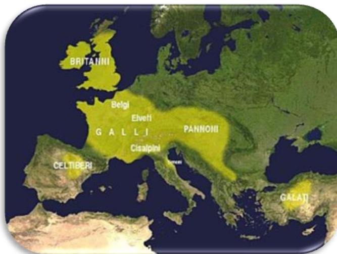
Slika 1 - Rasprostranjenost Kelta

Svi povijesni izvori koji su nam na raspolaganju su u neku ruku subjektivni, što je inače priroda povijesnih izvora ove vrste. Ali, oni nas ne spriječavaju pri karakteriziranju Kelta kao društva i pri karakteriziranju njihovog ratovanja. Najveći problemi nam dolaze radi kronologija i regionalnih varijacija pa nas generaliziranje u takvom slučaju može dovesti do krivih predodžbi i zaključaka. Dobar dio izvora se zato odnosi većinom na plemena koja su bila blizu Mediterana od četvrtog do drugog stoljeća, pa iz toga možemo otprilike rekonstruirati nekakvu sliku tih ljudi. Kasnije sličnosti s ponašanjem i ratovanjem, npr. Kelta u Britaniji, možda nisu vezane s arhaičnim ponašanjem Kelta kao grupe naroda, već s primitivnim ponašanjem i ratovanjem neovisno o vremenu, mjestu ili etničkoj pripadnosti. Prema Strabonu, Kelti su narod koji je