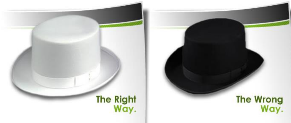
Sl. 6.1. Bijela i crna SEO tehnika

SEO, kao i sve ostalo u životu ima pozitivnu, dobru stranu te lošu, negativnu pa se tako i SEO tehnike mogu svrstati u dvije kategorije: tehnike koje pretraživači preporučuju koje uvelike pridonose boljoj rangiranosti na listi pretrage i one tehnike koje pretraživači ne odobravaju pa su takve stranice u većini slučajeva kažnjene zbog metoda kojima se služe, ukratko, neetične su. Takve se tehnike klasificiraju kao bijeli šešir ( eng. white hat ) i crni šešir ( eng. black hat ) SEO. Tehnika SEO bijelog šešira općenito osigurava bolje i dugotrajnije rezultate, dok se za tehniku SEO crnog šešira očekuje da će njihove web stranice u konačnici biti privremeno ili trajno zabranjene odnosno izuzete sa liste pretrage kada se primijete tehnike kojima se služe. Također postoji i SEO tehnika sivih šešira ( eng. gray hat ) koja se koristi dopuštenim i ne dopuštenim tehnikama.