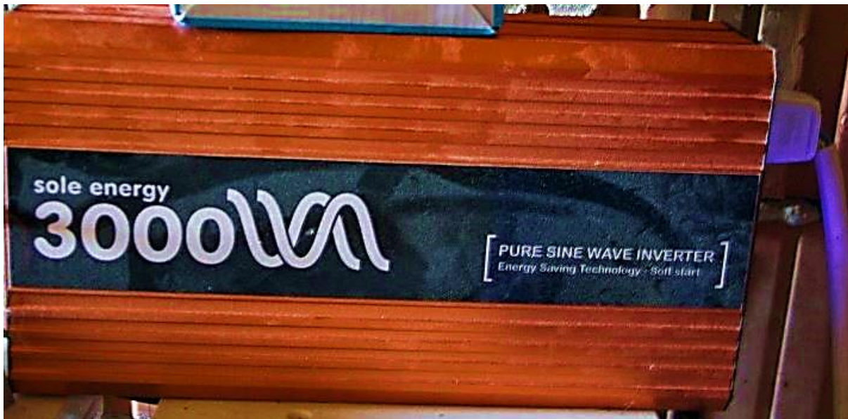
Sl. 3.4. Izmjenjivač koji vrši pretvorbu istosmjernog u izmjenični napon.

Sljedeća komponenta koja je dio fotonaponskog sustava je DC/AC pretvarač (slika 3.4.). DC/AC pretvarač (ili tzv. inverter) je elektronski uređaj koji se koristi za pretvaranje istosmjernog napona koji je prisutan u solarnim baterijama (akumulatorima) vrijednosti 12 V ili 24 V u izmjenični napon poznate vrijednosti od 230 V. [6]