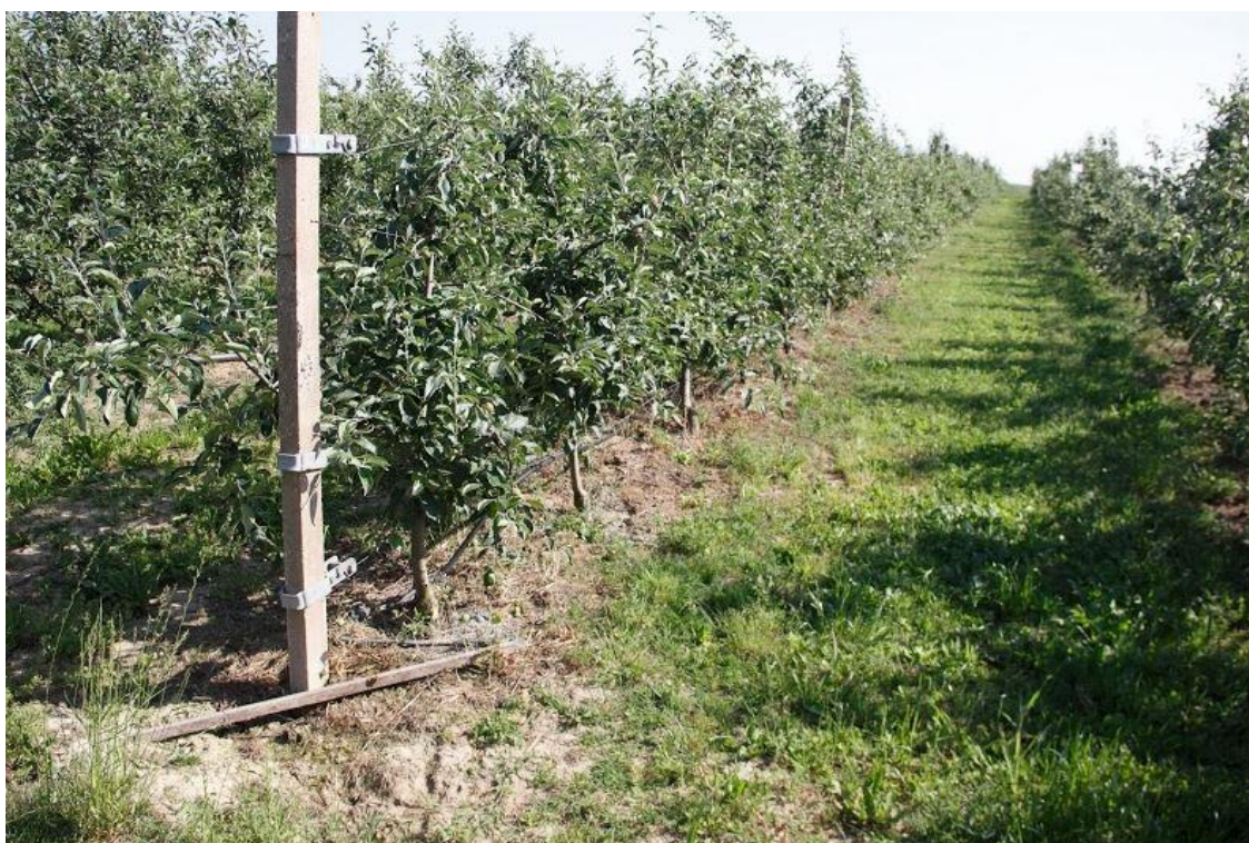
Sl. 5.1. Voćnjak na čijoj će se površini provoditi solarno navodnjavanje.

Odabrana površina za koju će se izvršiti proračun je voćnjak koji se nalazi u okolici Osijeka i prikazan je na slici 5.1.