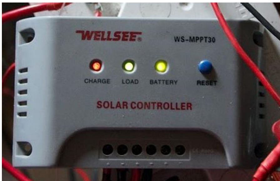
Sl. 3.2. MPPT regulator punjenja.

Drugu komponentu fotonaponskog sustava čini regulator punjenja. To je uređaj koji se postavlja između fotonaponskog modula i baterije. Glavni mu je zadatak kontrolirati samo punjenje baterije kako bi se omogućilo punjenje do najviše granice, ali ne i preko nje. Regulatori DC napona služe za pretvorbu istosmjernog promjenjivog napona u izrazito kontrolirane napone koji mogu puniti bateriju. Razlikuju se dvije vrste regulatora punjenja PWM (širinsko-impulsna modulacija, engl. pulse-width modulation ) i MPPT (praćenje točke maksimalne snage, engl. maximum power point tracking ). Slika 3.2. prikazuje jedan MPPT regulator.