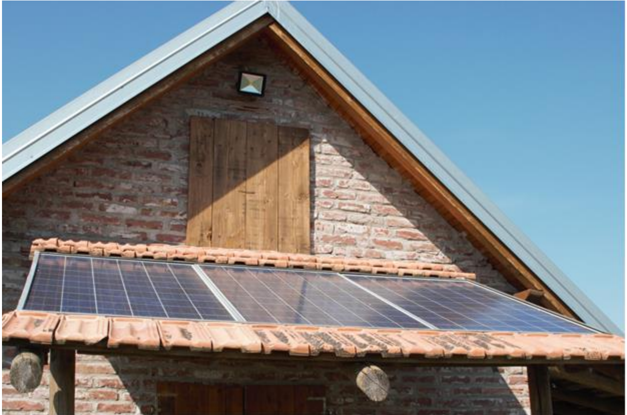
Sl. 3.1. Fotonaponski moduli u okolici Osijeka.

električne energije. Koliko će fotonaponskih modula biti potrebno postaviti odredit će se proračunom ovisno o snazi modula te kapacitetu baterije. Veličina fotonaponskog sustava ne ovisi o veličini posjeda (kvadraturi) nego o broju trošila, odnosno o tome koliko je potrebno električne energije da bi se zadovoljile dnevne potrebe.[2][6][7] Slika 3.1. prikazuje fotonaponske module smještene na krovu vikendice.