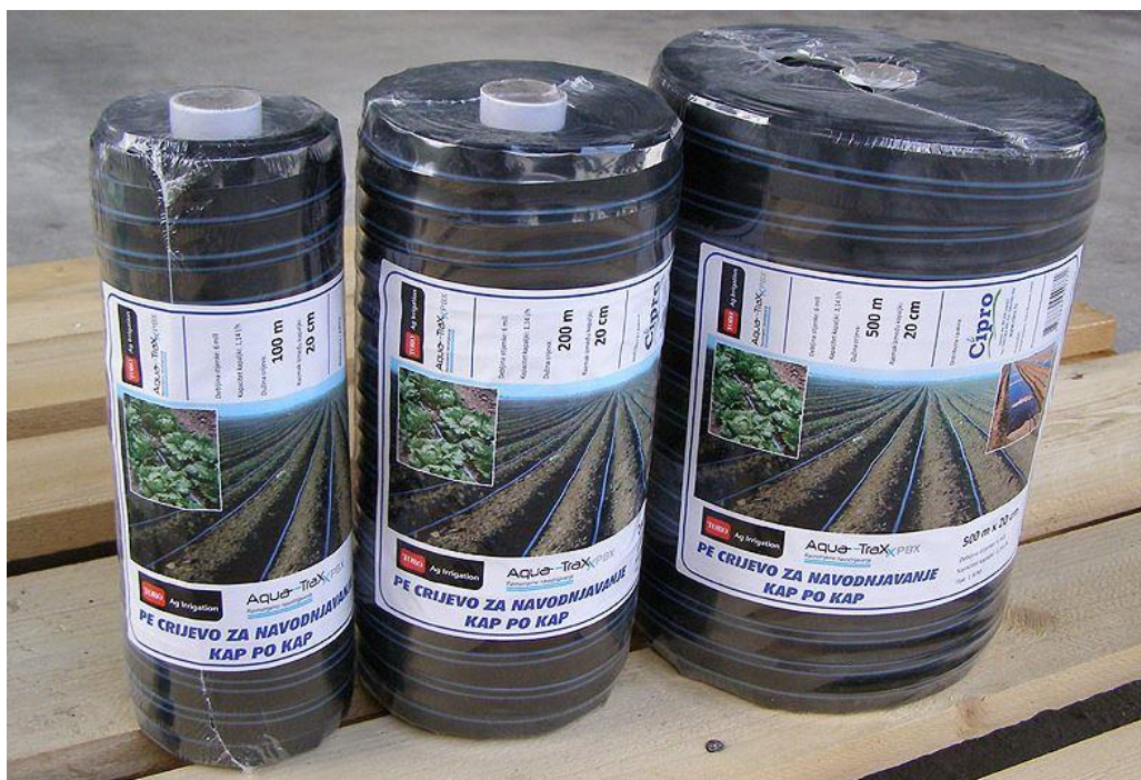
Sl. 4.1. Rupičasta crijeva prije postavljanja u sustav navodnjavanja.

Voda koju crpka crpi iz spremnika najprije dolazi do glavnog ventila kojim se omogućuje ili ne omogućuje danji protok vode, ovisno o potrebama potrošača. Voda do odredišta dolazi kroz cijevi. Cijevi mogu biti istog promjera ili različitih promjera. U slučaju različitih promjera, cijevi moraju biti spojene spojnicama kako bi postale kompatibilne (pravilan protok bez gubitaka na spojevima). Na crijeva kod kojih počinju redovi kulture koju se navodnjava stavljeni su obično mali ventili na koje se nastavljaju rupičasta crijeva (slika 4.1), odnosno crijeva kap na kap koja služe kao prskalice.