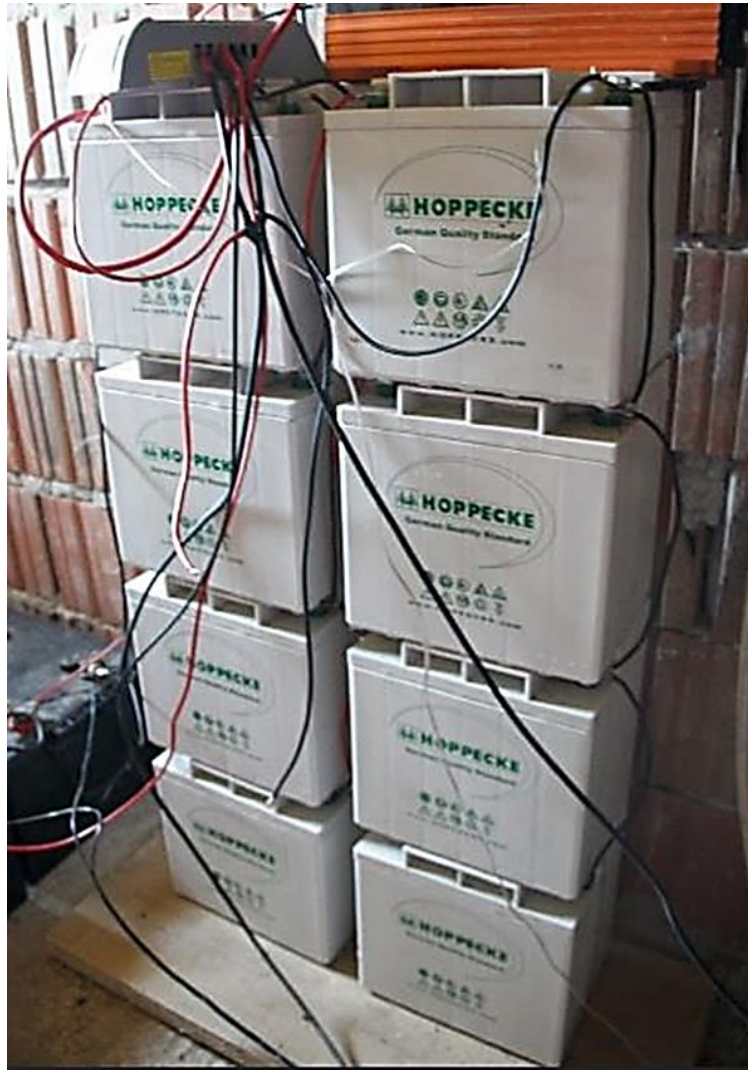
Sl. 3.3. Solarne baterije spojene serijski i paralelno.

te se odabiru kada se planira česta uporaba fotonaponskog sustava kao u slučaju navodnjavanja. Baterijama (Sl.3.3) se omogućava da crpka ima na raspolaganju dovoljno uskladištene energije. U slučaju nedovoljne osunčanosti kada fotonaponski moduli ne proizvode dovoljnu količinu energije crpka se napaja iz baterija.