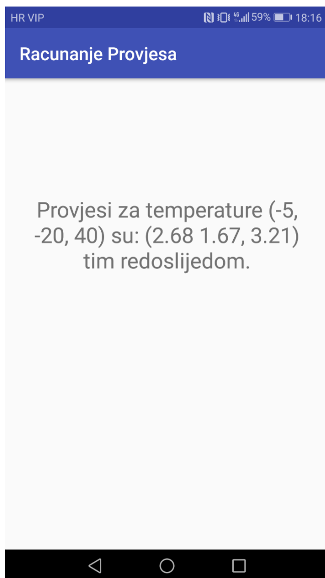
Slika 3.3 Prikaz rješenja

Pritiskom na dugme aplikacija pokazuje rješenje korisniku (slika 3.3).