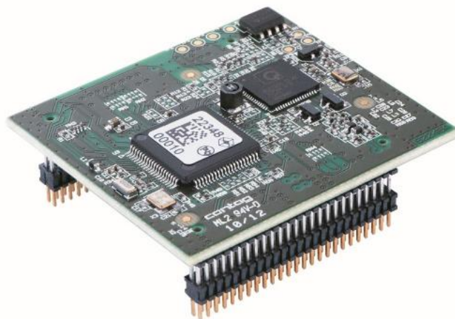
Slika 3.7. dLAN® Green PHY modul

dLAN® Green PHY modul je integriran uređaj za odašiljanje i primanje podataka putem električnih vodova. Ona ima sve funkcije potrebne za jednostavno kreiranje Green PHY mrežnih uređaja. Njegova brzina prijenosa podataka putem vodova se kreće do 10 Mbps. Njegov domet je 600 metara putem koaksijalnog kabela, 400 metara putem telefonske linije i 300 metara putem vodova. U potpunosti je kompatibilan sa GreenPHY i HomePlug AV standardima. Kupcima je omogućeno dodavanje ili prilagodba funkcija mijenjanjem upravljačkog softvera. Izvor 3,3 V, potrošnja energije < 1,5 W. Olakšava razvojni ciklus, montažu, testiranje i certifikaciju odobrenja.