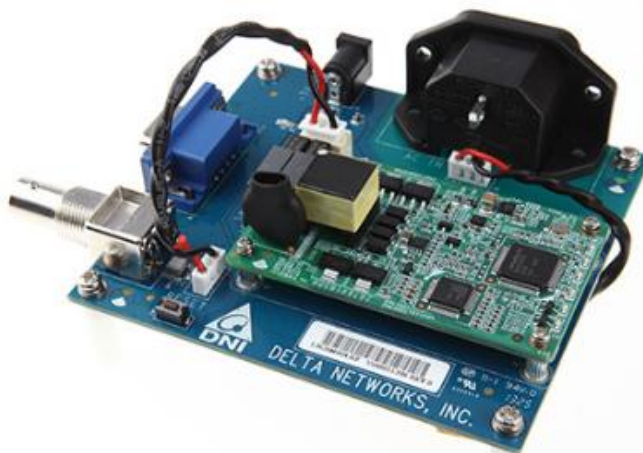
Slika 3.3. Izgled SGCM-P40

propusnost između odašiljača i prijemnika. Radna frekvencija mu je od 145,3 do 478,12. Flash memorija 512 kb, RAM memorija: 64 kb.