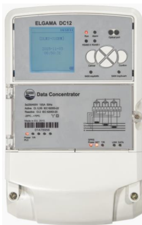
Slika 3.1. ELGAMA DC12 podatkovni koncentrator