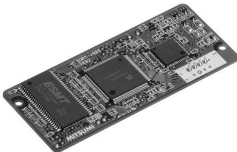
Slika 3.6. HD-PLC Modul DRT-J550

Jedan od mnogih modula koji koriste IEEE 1901 je HD-PLC Modul DRT-J550. Velike brzine prijenosa podataka su moguće pomoću postojećih vodova, kao što su vodovi unutar kuće. DRT-J550 koristi frekvencijski pojas od 2 do 28 MHz. Brzina prijenosa podataka na fizičkom sloju se kreće do 240 Mbps. Ima malu potrošnju energije.