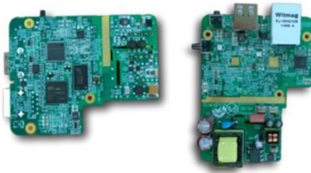
Slika 3.5. Merryvale G.hn PLC modul

Modul koji radi na ITU-T standardu je Merryvale G.hn PLC modul. Podržava frekvencijske pojase od 25, 50 i 100 MHz. Ovaj integrirani uređaj objedinjuje sve funkcije G.hn PHY i G.hn MAC slojeva. Raspon napona na kojem radi je od 110 do 240 V izmjenično. Podržava topologiju mreže do 8 čvorova. PHY sloj radi retransmisije kako bi prevladao trenutne impulse šuma i garantira isporuku podataka.