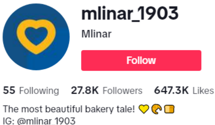
Slika 4: Mlinar profil na TikToku

Sa slike 4 može se vidjeti kako se Mlinar tvrtka na TikToku zove „mlinar_1903“. Brojka 1903 u nazivu označava datum osnivanja i početak njihovog postojanja. Iz priloženog se može vidjeti kako prate 55 ljudi, njih prati preko 27 tisuća korisnika, a ukupno imaju preko 647 tisuća oznaka „sviđa mi se“.