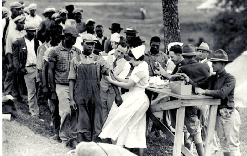
Slika 2 Sudionici eksperimenta u Tuskageeju