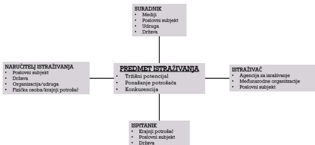
Slika 1 Sudionici u istraživanju tržišta

Sudionik u istraživanju tržišta može biti svaka fizička ili pravna osoba koja zauzima barem jednu od četiri moguće uloge, a te uloge se odnose na istraživača, ispitanika, istraživačevog suradnika i naručitelja istraživanja.