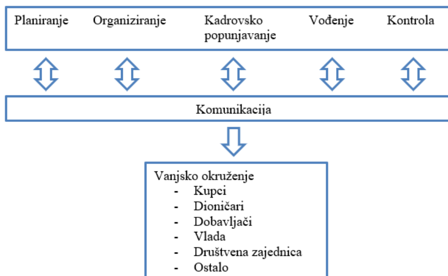
Slika 1. Svrha i funkcije komunikacije (Granča i Kadlec, 2011:120)

Komunikacija ima četiri osnovne funkcije unutar grupe ili organizacije: motiviranje, kontroliranje, informiranje i emocionalno izražavanje. Kontroliranje se odnosi na poštivanje politike organizacije, odnosno hijerarhije nadležnosti koja uvjetuje informiranje prvo nadređenih i menadžmenta. Komunikacija motivira jer objašnjava zaposlenicima što trebaju raditi, na koji način obavljaju zadatke, kako poboljšati radne performanse. Također omogućava emocionalno izražavanje te ispunjavanje društvenih potreba. U konačnici komunikacija informira grupe i pojedince prenoseći im podatke potrebne za donošenje odluka. Iz navedenog se može doći do logičnog zaključka kako je temeljna funkcija komunikacije uspostava i realizacija ciljeva organizacije, potom razvoj planova kako bi se isti ostvarili te izbor, razvoj i ocjenjivanje svih pripadnika organizacija, njihovo motiviranje, kvalitetno vođenje te usmjeravanje zaposlenika i na kraju kontrolna točka cjelokupnih ostvarenja organizacije (Robbins i Judge, 2014:368).