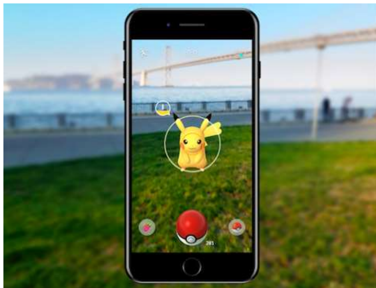
Slika 6. Aplikacija Pokemon Go (dostupno na: https://niantic.helpshift.com/hc/en/6-pokemon-go/faq/28-catching-pokemon-in-ar-mode/ )

aktivnih mobilnih korisnika koji se služe AR tehnologijom je 810 milijardi. Kako navodi Javornik (2016.), prva komercijalna AR aplikacija razvijena je 2008. godine u svrhu oglašavanja jedne njemačke agencije, dok je značajan porast tehnologija doživjela s aplikacijom Pokemon Go koja je 2016. godine doživjela vrhunac, a paralelno s njom se razvijala i aplikacija Snapchat.