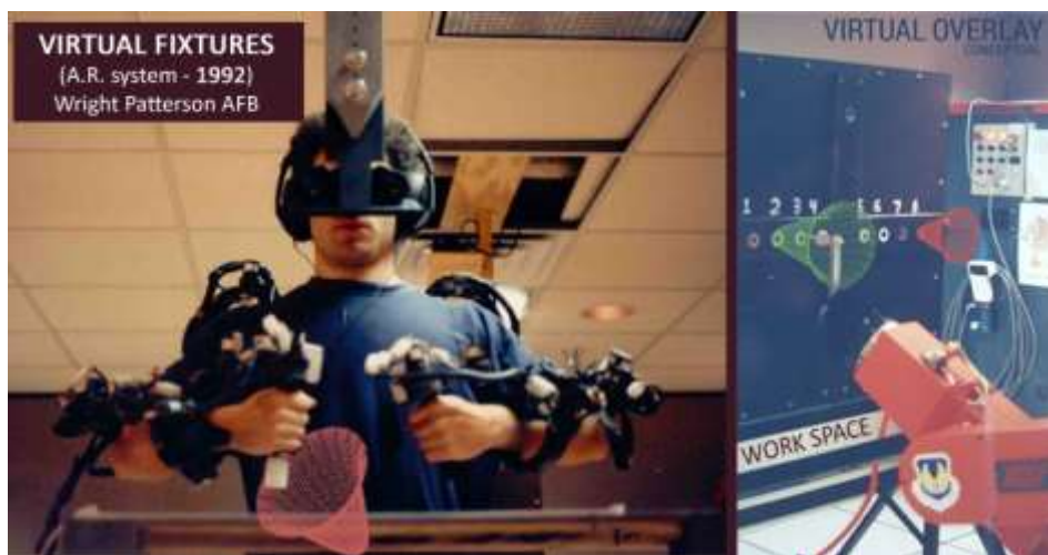
Slika 5. Virtual Fixtures 1992.

Zatim, 1975. godine, američki računalni umjetnik Myron Krueger razvio je prvu virtualnu stvarnost, sučelje koje je svojim korisnicima pružalo mogućnost manipuliranja i interakcije s virtualnim objektima u stvarnom vremenu. Iako se tako naizgled čini, navedene izumljene tehnologije nisu predstavljale niti pravu virtualnu stvarnost niti proširenu stvarnost. Po prvi puta izraz „proširena stvarnost“ pojavio se 1990. godine od strane T. P. Caudell-a. Prvi ispravno funkcionalni sustav proširene stvarnosti jest onaj razvijen od strane Louisa Rosenberga 1992. godine. Sustav se nazivao Virtual Fixtures te je predstavljao vrlo složen robotski sustav s mogućnošću preklapanja senzornih informacija u radnom prostoru kako bi se povećala produktivnost radnika.