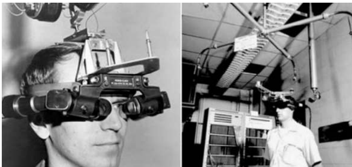
Slika 4. Uređaj Ivana Sutherlanda „ Helmen Mounted Display (HMD) “ (dostupno na: file:///C:/Users/karla/Downloads/norman_kodan - prosirena stvarnost%20(1).pdf )

Proširena stvarnost je po prvi puta, u određenoj mjeri, postignuta od strane kinematografa zvanog Morton Heilig 1957. godine. Heilig je izumio Sensoramu koja je gledatelju isporučivala vizualne slike, zvukove, vibracije i mirise, no iako uređaj nije bio računalno upravljani, bio je prvi pokušaj dodavanja dodatnih vrijednosti iskustvu korištenja. Nakon toga je američki računalni znanstvenik Ivan Sutherland 1968. godine izumio zaslon koji se montira na glavu te predstavlja tzv. „prozor u virtualni svijet“. S obzirom na razdoblje u kojemu je uređaj izumljen, korištenje takve tehnologije bilo je nepraktično za masovnu upotrebu.