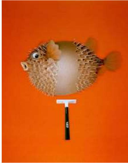
Slika 1. Primjer kreativnog oglasa (dostupno na: https://www.pinterest.com/pin/70437486143048/ )