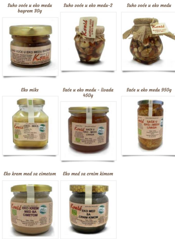
Slika 7. Pripravci s medom - Ekološko OPG pčelarstvo Krnić