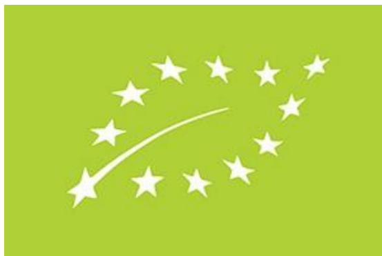
Slika 5. Ekološki znak

Nadalje, s obzirom na to da je Republika Hrvatska u Europskoj uniji, svi proizvodi koju su ekološki proizvedeni na sebi moraju imati jedinstveni vizualni identitet, Ekološki znak (Slika 5).