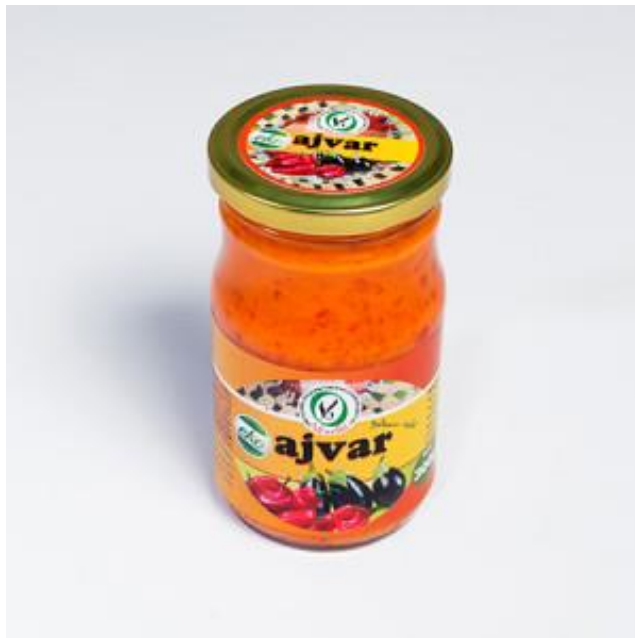
Slika 12. Eko proizvod - ajvar - OPG Veselić