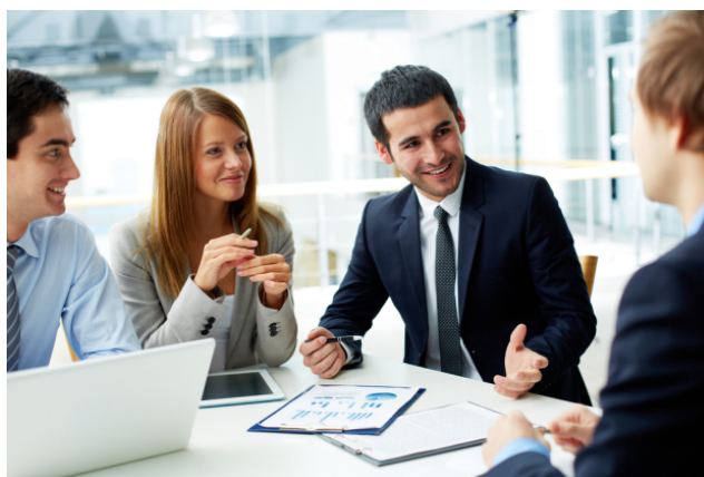
Slika 3. Komuniciranje za vrijeme sastanka