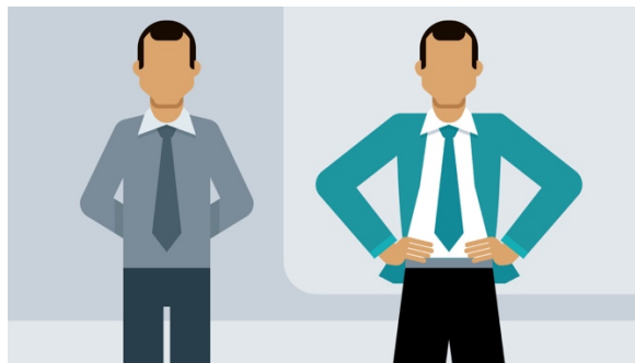
Slika 5. Stav tijela