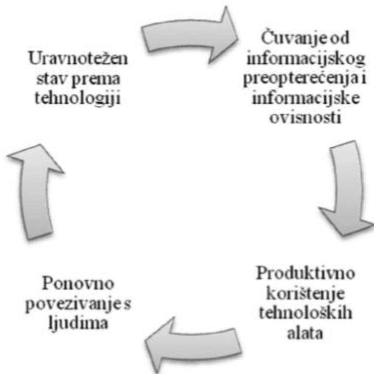
Slika 2: Strategija uspješnog korištenja tehnologije (Izvor: Jurković, Marošević, 2013:498)

Ipak, ne smije se zaboraviti da je tehnologija samo alat pomoću kojeg se mogu obavljati određeni zadaci. Iako je postavila trendove u komunikacijskom smislu ipak služi kao dodatak interpersonalnoj komunikaciji i ne smije ju zamijeniti. “Bez obzira koliko je egzotična i suvremena, tehnologija ima vrijednost samo ako pomaže u dostavljanju pravih informacija pravim ljudima u pravo vrijeme” (Jurković, Marošević, 2013:498). Iako tehnologija čini veliki dio komunikacije unutar organizacije, ona ne bi trebala biti dominantna i prevladavati. Previše tehnologije može dovesti do nemogućnosti razlučivanja korisnih od beskorisnih informacija. Samim time s preopterećenošću informacijama dolazi do kontraproduktivnosti djelatnika i njihove nezainteresiranosti. Sve to utječe na radnu klimu i rezultate unutar organizacije, pa je tako potrebno pronaći umjerenost u informacijskoj tehnologiji kako ne bi došlo do preopterećenja. Kako bi se spriječio navedeni scenarij postoji strategija uspješnog korištenja komunikacijske tehnologije koja je prikazana u nastavku slikom 2.