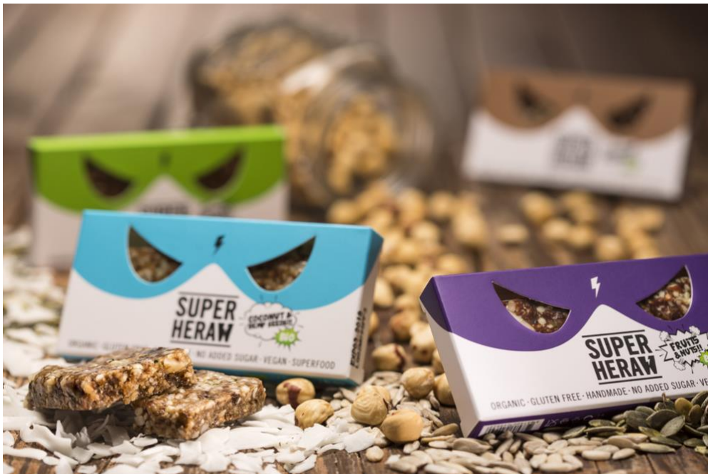
Slika 2. Važnost pakiranja

U fazi otklanjanja prigovora važno je da prodavač ostane svjestan kako kupac nije protiv njega, nego je iz nekog razloga nezadovoljan proizvodom i želi ga vratiti ili zamijeniti. Prigovore treba riješiti brzo i bez većih stresova. Kupcu se može dati anketni upitnik kojim ga se pita iz kojeg