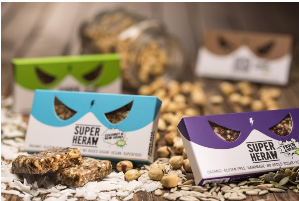
Slika 2. Važnost pakiranja

U fazi otklanjanja prigovora važno je da prodavač ostane svjestan kako kupac nije protiv njega, nego je iz nekog razloga nezadovoljan proizvodom i želi ga vratiti ili zamijeniti. Prigovore treba riješiti brzo i bez većih stresova. Kupcu se može dati anketni upitnik kojim ga se pita iz kojeg