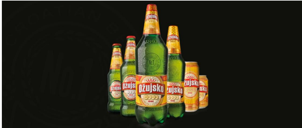
Slika 6. Razna pakiranja i ambalaža Ožujskog piva