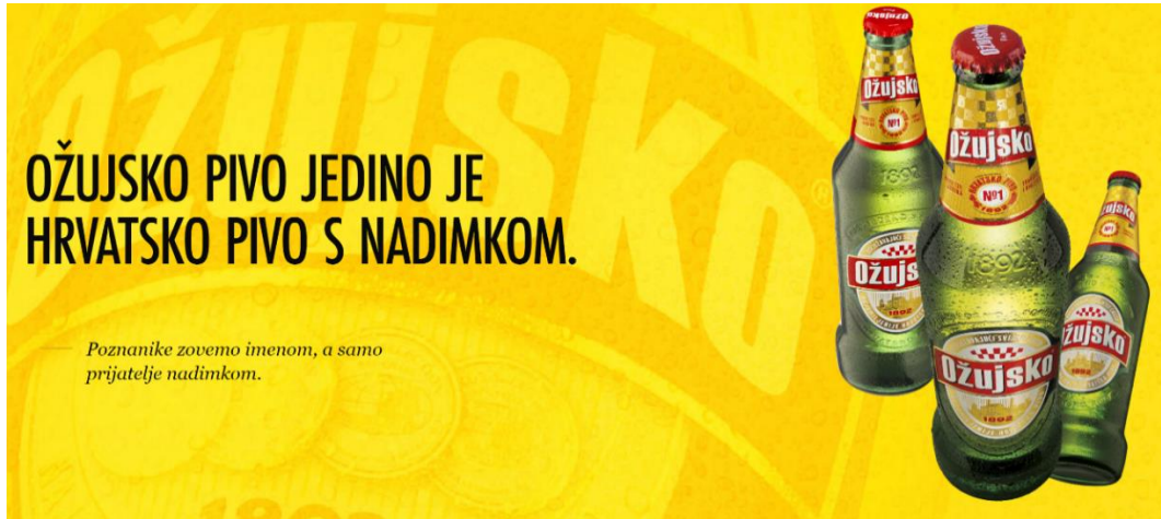
Slika 5. Vizual na službenoj stranici Ožujskog piva