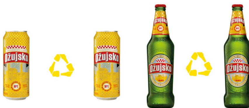
Slika 1. Reciklažna ambalaža Ožujskog piva – glavnog brenda Zagrebačke pivovare

Čak 72% svih limenki u Hrvatskoj se recikliraju, a moguće je iskoristiti čak 96,5% aluminija za novu proizvodnju limenki!