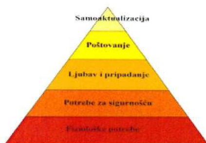
Slika 3.: Teorija potreba

Teoriju hijerarhije potreba – prema ovoj teoriji postoji čvrsta hijerarhija potreba, i tek zadovoljavanjem niže potrebe možemo prijeći na višu razinu potreba. Najpoznatija je Maslowljeva piramida koja potrebe rangira na pet nivoa: egzistencijalne potrebe, potrebe sigurnosti, potrebe pripadanja, potrebe poštovanja i potreba samoaktualizacije.