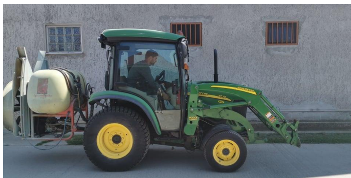
Slika 2 Voćarski traktor John Deere 007 3720

Gospodarstvo posjeduje mali voćarski traktor John Deere 007 3720, stroj za okopavanje sadnica, prskalica Tolmet 1000 L, Felco baterijske škare, voćarska platforma, malčer, meteo stanicu. U sklopu voćnjaka OPG također posjeduje i montažnu kućicu od metalnih panela u kojoj se nalaze dvije prostorije, u jednoj glavni sustav za navodnjavanje i izvodi, a u drugoj ormare u koje se skladište sredstva za zaštitu bilja.