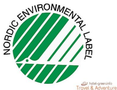
Slika br.2 Oznaka za proizvode od papira

Dostupno na: https://hr.hotel-green.info/351-finnish-quality-how-to-understand-the-signs-on-the-pa.html (pristupljeno 21.srpnja 2019.)