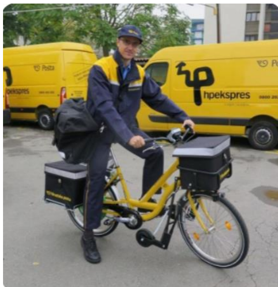
Slika br. 6 Poštar Hrvatske pošte na e-biciklu

Nakon objavljivanja poziva za nadmetanje pristigle su četiri ponude. Ukupna investicija bila je 492.000 eura, od kojih 150.000 eura osigurava Fond za zaštitu okoliša i energetska učinkovitost hrvatske vlade koji subvencionira dio troškova kupnje električnih vozila za pojedince, tvrtke i javne organizacije. U odnosu na trenutno stanje, očekuje se godišnja ušteda od 166.616 eura (1.249.617 hrvatskih Kuna) (otprilike 926 eura po skuteru), a Hrvatska pošta izračunala je kako je otkupna cijena motornih skutera bila oko 1800 eura, e-bicikala između 2.000 i 2.600 eura, a kvalitetnog e-skutera oko 5.500 eura. Godišnji troškovi održavanja 180 skutera s konvencionalnim gorivom su 143.113 eura (1.077.080 kuna), a godišnji troškovi održavanja 180 e-bicikala su 24.000 eura (180.000 kuna). Nadalje, uštedjet će gotovo 47.000 eura na napuštanju motornog goriva s obzirom da će 180 konvencionalnih skutera potrošiti 43.200 litara goriva, a 180 e-bicikala treba 43.875,00 kWh energije. Također, vrijedno je spomenuti i smanjenje razine zagađenja bukom, alternativnom uporabe e-bicikala. Hrvatska pošta zaključila je da su e-bicikli bolje rješenje za njihove potrebe u prijevozu od klasičnih skutera koji imaju domet od 25-40 kilometara dok e-bicikli nude isti domet, no još ih uvijek možete voziti kada im se isprazni baterija. (Europska komisija)