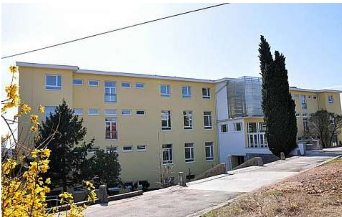
Slika 4: Step Ri znanstveno-tehnološki park Sveučilišta u Rijeci