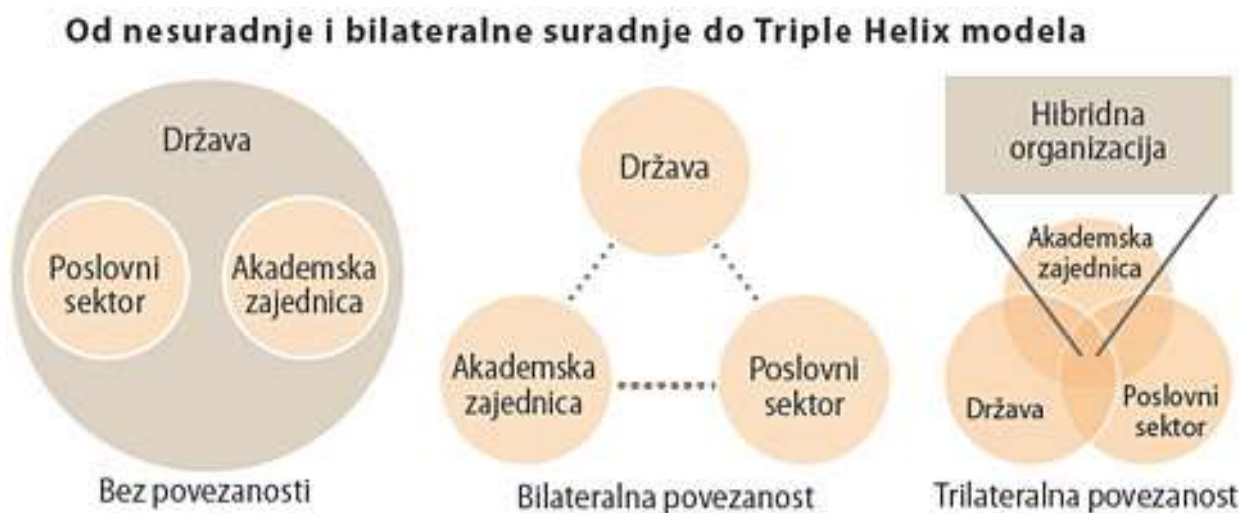
Slika 1: Od nesuradnje i bilateralne suradnje do Triple Helix modela