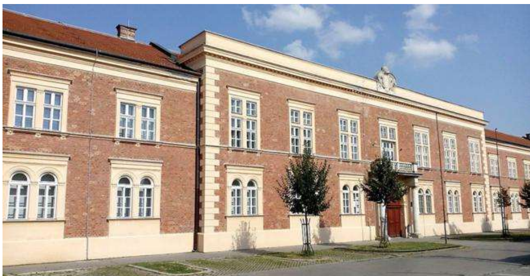
Slika 6: Tera Tehnopolis d.o.o.