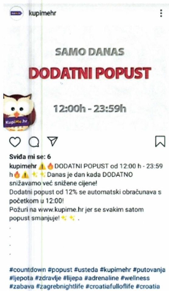
Slika 3. Oglas na Instagramu agencije KupiMe.hr