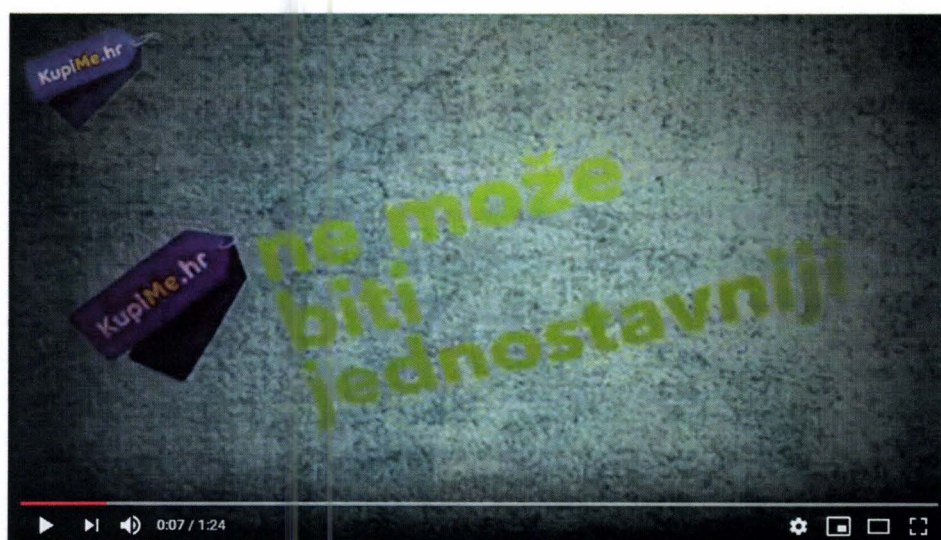
Kako Poslušemo /// KupiMe.hr