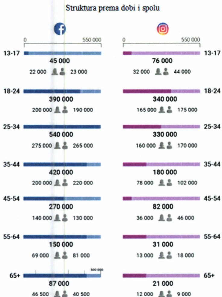
Slika 1: Usporedba korištenja Facebooka i Instagrama u RH