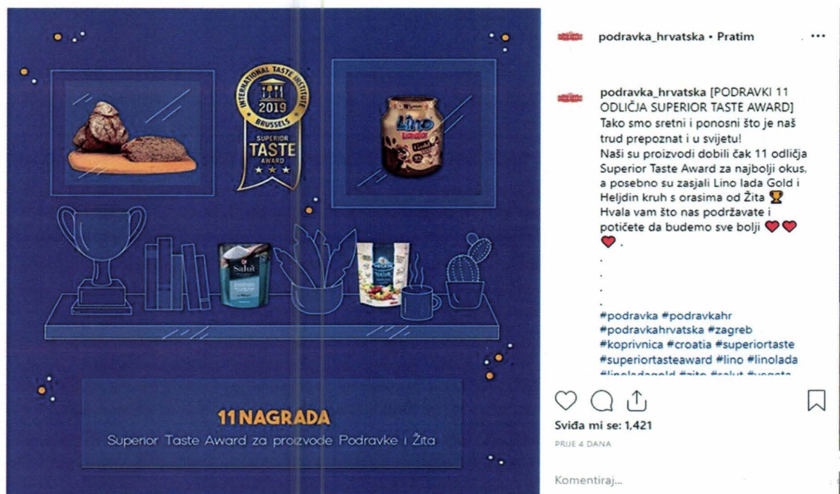
Slika 7. Oglas Lino lada na Instagramu