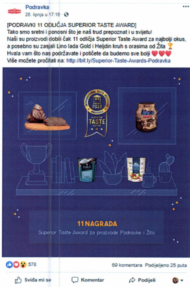
Slika 6. Oglas Lino lada na Facebooku

Kao primjer usporedit će se oglašavanje proizvoda Lino lada Gold poduzeća Podravka koje oglašava svoje proizvode na Facebooku, Instagramu i YouTube-u.