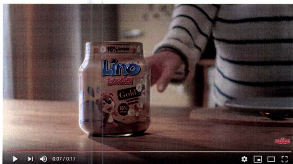
Lino lada - Razmaži me sada