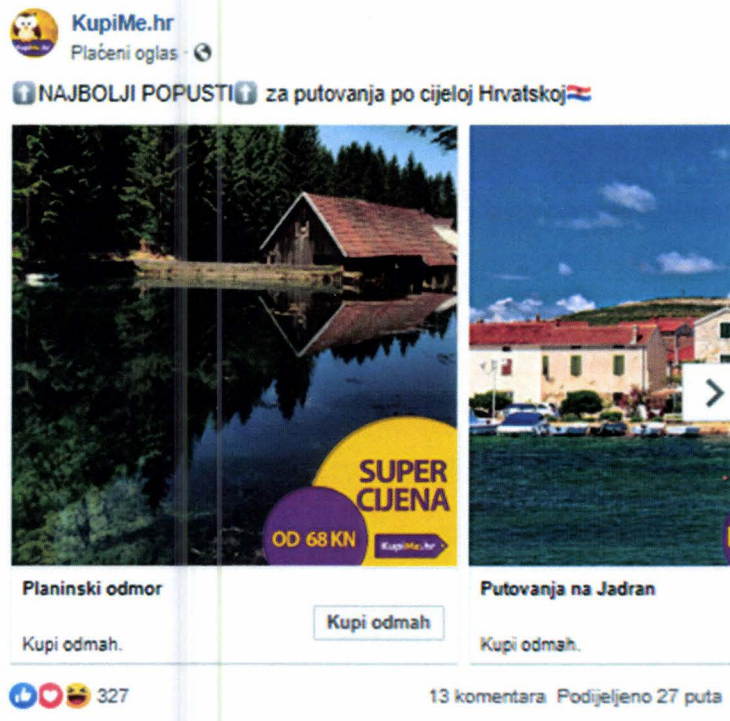
Slika 2. Oglas na Facebooku agencije KupaMe.hr