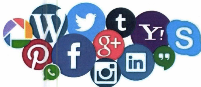
Slika 5. Logo različitih društvenih mreža