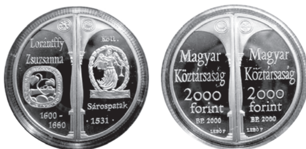
Slika 1. 2000 forinti + 2000 forinti, 2000. godina, avers i revers