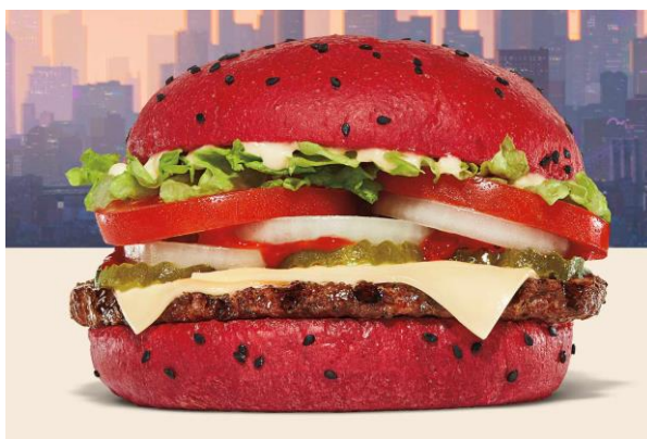
Slika 5: Spider - Verse Whopper

Povodom izlaska filma Spider – Man: Across The Spider – Verse, Burger King je u svoju ponudu dodao „Spider – Verse“ Whopper. Haburger je estetski prilagođen glavnom junaku filma. Lepinja je crvene boje posipana crnim sjemenkama što podsjeća na kostim Spidermana, uz to je na čaše pića naljepio poster s njegovim likom (Santiago, 2023).