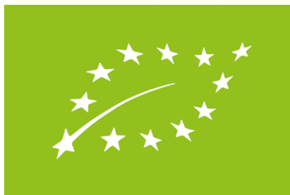
Slika 2. Ekološki znak

Kako bi potrošači bili sigurni da koriste isključivo ekološki proizvod koji je proizveden u Europskoj uniji na svakom proizvodu nalazi se ekološki znak. On je potvrda strogo određene proizvodnje, prerade, prijevoza i skladištenja. Svaki proizvod koji u svome sastavi ima najmanje 95% sastojaka ekološkog podrijetla, uz uvjet da je ostalih 5% sastojaka pregledano od stručne komisije te zadovoljava određene stavke, ponosni je nosilac ekološkog znaka.