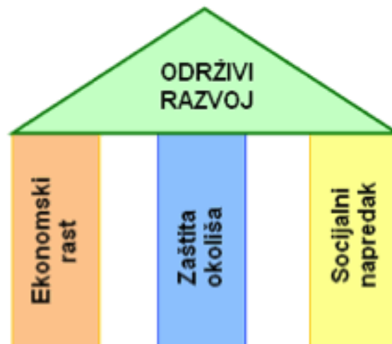
Slika 1. Komponente održivog razvoja

Održivi razvoj, kako navodi WCED (1987.), temelji se na zadovoljenju potreba sadašnjih i budućih generacija na način da se prilikom zadovoljenja potreba sadašnjih generacija ne ugrozi zadovoljenje potreba budućih generacija. Cilj održivog razvoja je stvoriti održive organizacije koje će omogućiti razvoj pojedinca sa različitih stajališta kao što su ekonomsko, političko, kulturno i slično. Na Slici 1. prikazane su tri komponente na kojima se temelji održivi razvoj: socijalna komponenta, ekonomska komponenta i zaštita okoliša.