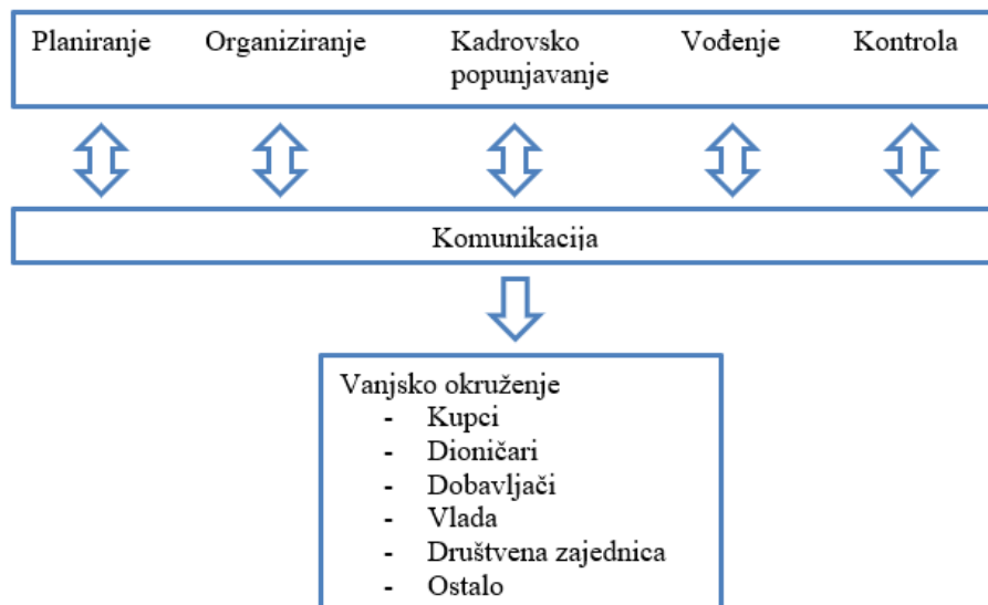
Slika 1. Svrha i funkcije komunikacije (Granča i Kadlec, 2011:120)

Komunikacija ima četiri osnovne funkcije unutar grupe ili organizacije: motiviranje, kontroliranje, informiranje i emocionalno izražavanje. Kontroliranje se odnosi na poštivanje politike organizacije, odnosno hijerarhije nadležnosti koja uvjetuje informiranje prvo nadređenih i menadžmenta. Komunikacija motivira jer objašnjava zaposlenicima što trebaju raditi, na koji način obavljaju zadatke, kako poboljšati radne performanse. Također omogućava emocionalno izražavanje te ispunjavanje društvenih potreba. U konačnici komunikacija informira grupe i pojedince prenoseći im podatke potrebne za donošenje odluka. Iz navedenog se može doći do logičnog zaključka kako je temeljna funkcija komunikacije uspostava i realizacija ciljeva organizacije, potom razvoj planova kako bi se isti ostvarili te izbor, razvoj i ocjenjivanje svih pripadnika organizacija, njihovo motiviranje, kvalitetno vođenje te usmjeravanje zaposlenika i na kraju kontrolna točka cjelokupnih ostvarenja organizacije (Robbins i Judge, 2014:368).