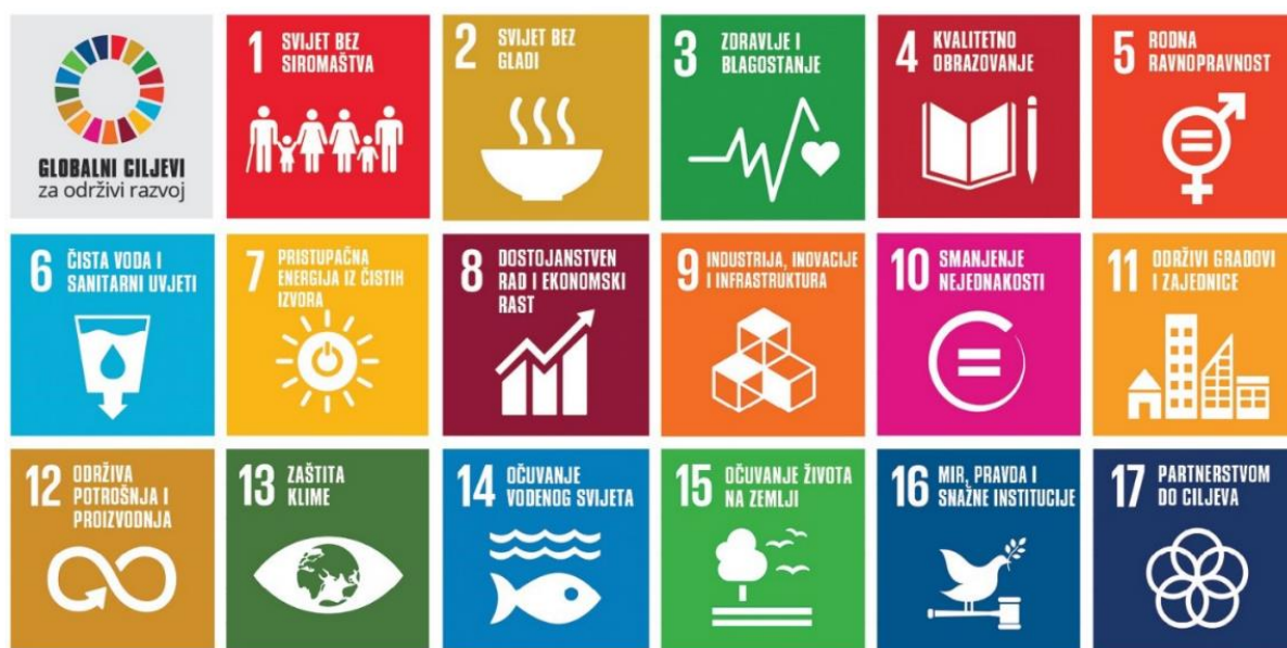
Slika 2. Globalni ciljevi održivog razvoja 2030, UN