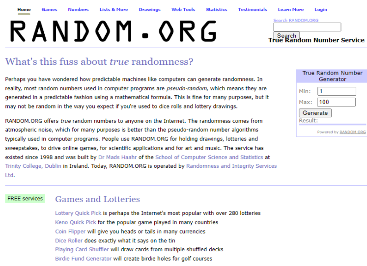
Slika 1. Primjer programa za generiranje slučajnog odabira random.org (Dostupno na: https://www.random.org , pristupljeno: 19. 9. 2022.)