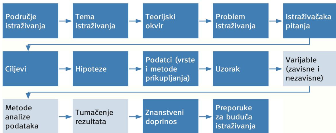
Slika 1: Istraživački proces

Uzorkovanje je dio kvantitativnog istraživačkog procesa (slika 1). „Istraživački proces temelji se na – prethodnim istraživanjima i izučavanju literature, odabiru metodologije istraživačkog rada, prikupljanju podataka i analizi podataka i tumačenju rezultata“ (Horvat i Mijoč, 2019:37). Uzorci se obično primjenjuju s namjerom kako bi se dobila slika o populaciji u cjelini, bez potrebe za promatranjem svakog člana te populacije.