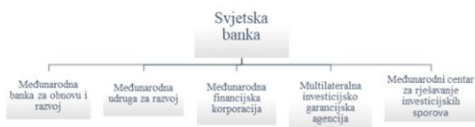
Slika 1. Struktura Svjetske banke, izvor: izrada autora prema: a http://poslovnisvijet.ba/institucije-grupacije-svjetske-banke/