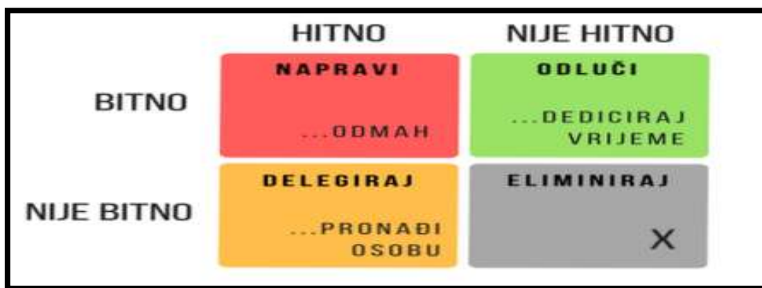
Slika 2. Matrica HITNO/BITNO

Bitno je analizirati svoje ciljeve kroz ove kategorije kako se ne bi dopustilo da stvari nižeg prioriteta ugroze stvari višeg prioriteta. Kada se govori o aktivnostima njih možemo podijeliti u koordinati hitnosti i bitnosti.