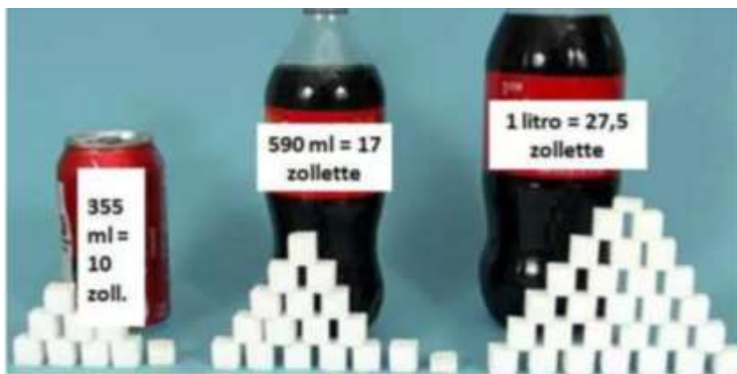
Slika 3. Količina šećera u proizvodu Coca-Cola", maisonjardin.net, 2021.

Njihovo mišljenje je da razlozi pretilosti potrošača nisu nezdrava hrana i korištenje pića punih šećera u zapadnim zemljama, nego samo nedostatak vježbanja. Ovime je ciljano maknuta pažnja sa proizvoda Coca Cola, Sprite, Fanta i drugih pića koji su u vlasništvu tvrtke Coca-Cola. Riječ je o zavaravanju kupaca kako je za rješavanje problema pretilosti dovoljno baviti se tjelesnom aktivnošću, te nije potrebno smanjiti unos kalorija (Biagioli, 2021).