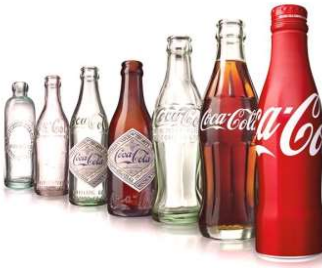
Slika 2. Oblici ambalaže Coca-Cola tijekom godina, andamanislandtrip.com, 2019.

„Njihova marka uključuje proizvode: Coca-Cola, Sprite, Fanta i ostatak bezalkoholnih pića. Njihovu marku kave i čaja čine: Dasani, Smartwater, Vitaminwater, Topo Chico, Powerade, Costa, Georgia, Gold Peak, Honest i Ayataka. Marku biljnih napitaka, prehrane, mliječnih proizvoda i sokova čine: Minute Maid, Simply, Innocent, Del Valle, Fairlife i AdeS“ (The Coca-Cola company, 2021).