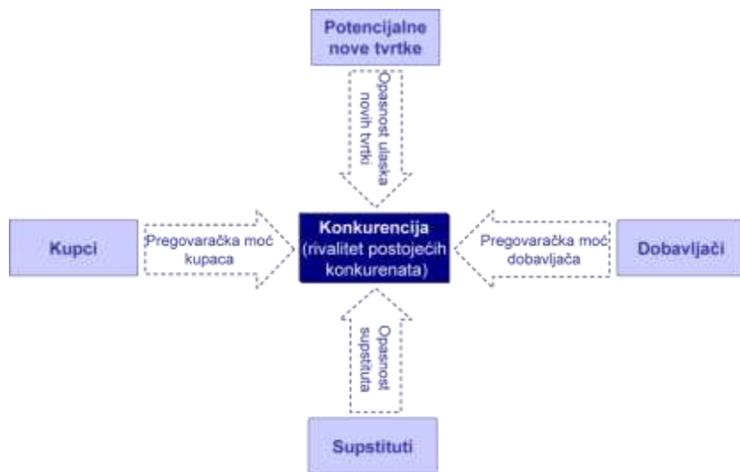
Slika 1. Porterov model pet sila, Argus grupa, 2019.

Porter tvrdi da pojedina industrija posjeduje strukturu ili određene karakteristike kojima se stvara konkurentna prednost. Prvenstveno je važno razumjeti pojam okruženja kako bi se strategijom iskoristio dobar utjecaj okruženja na poduzeće. Postoji pet osnovnih sila u konkurenciji, koje su ključne za stvaranje željenog profita u poslovanju (Dilberović, 2019:8).