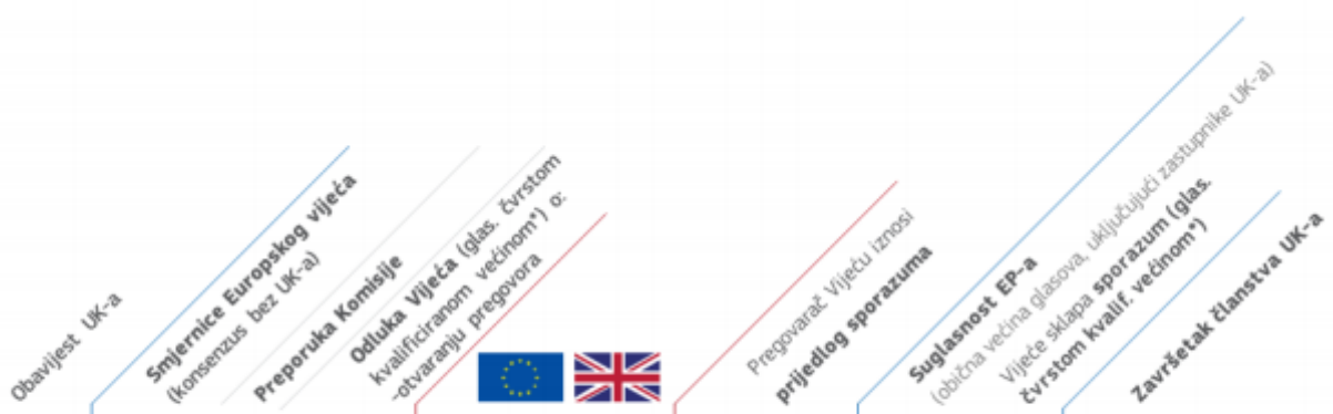
Slika 3 .Postupak izlaska Velike Britanije iz EU

Ujedinjeno Kraljevstvo zapravo odlučuje o samoj aktivaciji članka 50., ali poslije nego što članak bude aktiviran nije moguće jednostrano zaustaviti odnosno poništiti postupak. Također, vraćanje na prijašnje stanje nije moguće.