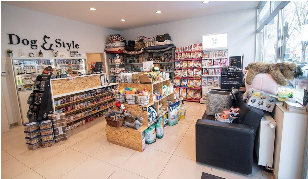
Slika 2. Trgovina Dog&Style