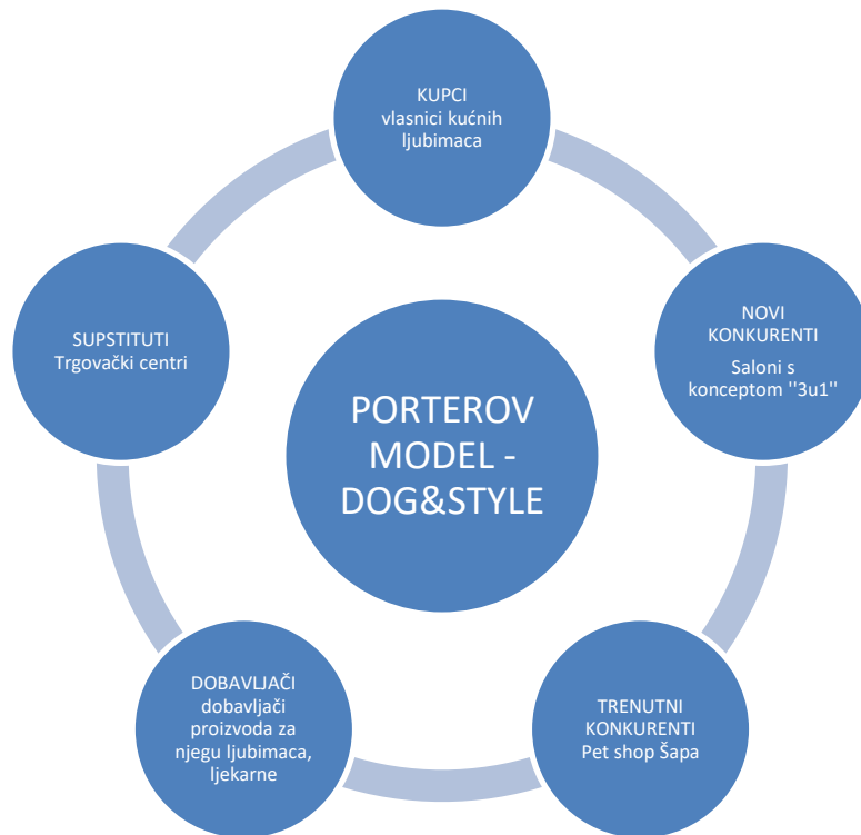
Slika 6. Analiza franšize Dog&Style prema Porterovom modelu

U nastavku će biti prikazana analiza franšize Dog&Style prema Porterovom modelu 5 konkurentskih snaga (Slika 6).