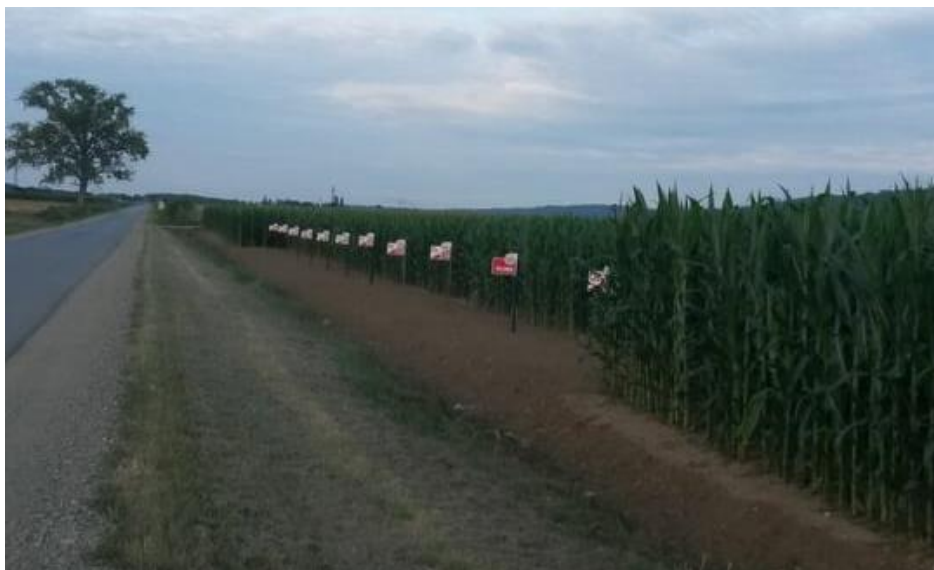
Slika 8 Kukuruz, ogledno polje OPG-a Strajnić