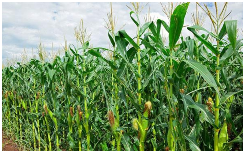
Slika 6 Kukuruz

Rani hibridi su oni koji imaju vegetaciju 90 do 110 dana. Srednje rani hibridi su oni koji imaju vegetaciju 120 do 135 dana, te kasni hibridi su oni koji imaju vegetaciju os 135 do 145 dana. Kukuruz je kao biljka veoma važna kako za ljude tako i za životinje, s obzirom na obujam i raznovrsnost uporabe, nije ni čudno što je jedna on najaktualnijih biljaka kako u Hrvatskoj tako i u svijetu. Veliki ekonomski značaj ima iz razloga sto se gotovo svi dijelovi mogu uporabiti. Danas ima više od 500 vrsta preradevina od kukuruza (razni napitci, kozmetika, lijekovi, kemijski proizvodi i sl.) (Agroklub).