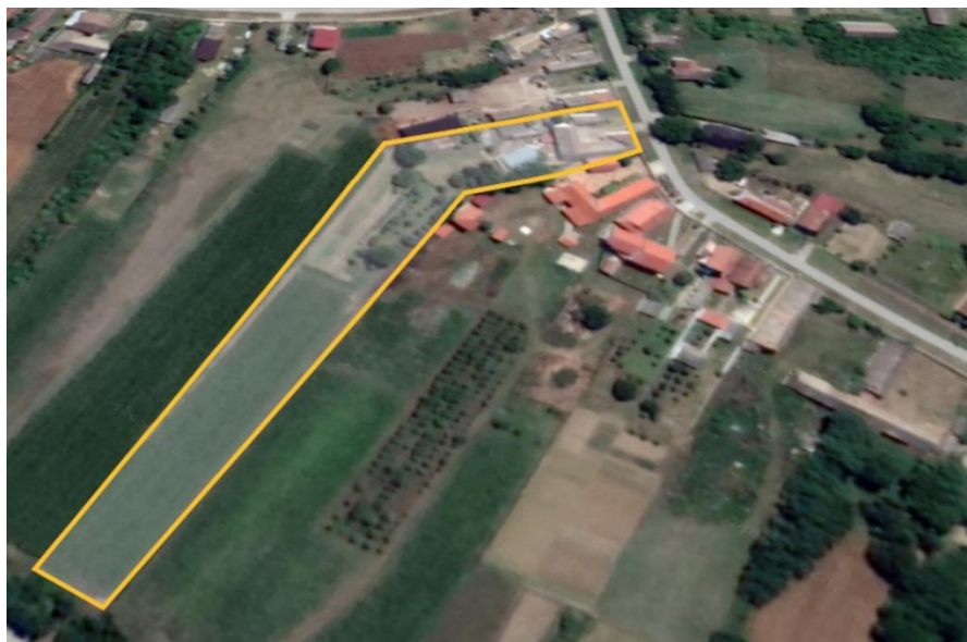
Slika 1 Gospodarsko dvorište i vrt OPG-a Strajnić

Kako bi se što bolje objasnila problematika ekonomike ratarske proizvodnje, odabrano se jedno manje poljoprivredno gospodarstvo koje se nalazi u Osječko-baranjskoj županiji, točnije u ulici Đure Đakovića 23, Popovac. Gospodarstvo ima jednog zaposlenog, koji je ujedno i vlasnik. Povremeno u obavljanju poslova sudjeluje i supruga. Gospodarstvo je upisano u sustav PDV-a, te vodi sva potrebna poslovna knjiženja sukladno Zakonu poreza na dohodak.