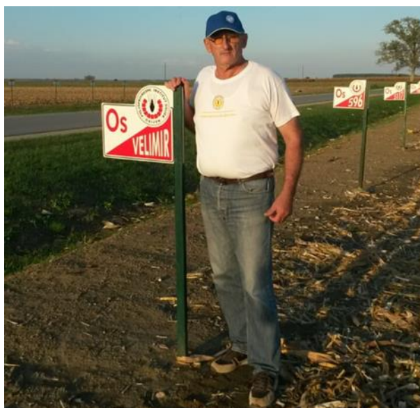
Slika 7 Vlasnik OPG-a Strajnić na oglednom polju