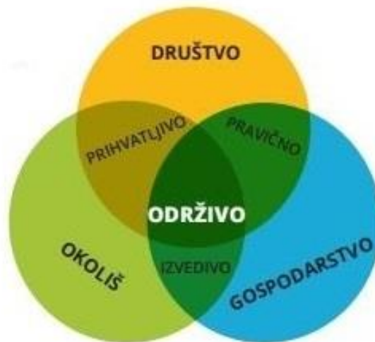
Slika 1: Stupovi održivog razvoja

Cilj održivog razvoja je trojak. On teži gospodarskoj učinkovitosti (ekonomskom razvoju) , društvenoj odgovornosti (socijalnom napretku) i zaštiti okoliša . Tri prethodno navedene stavke se još popularno nazivaju i stupovima održivog razvoja.