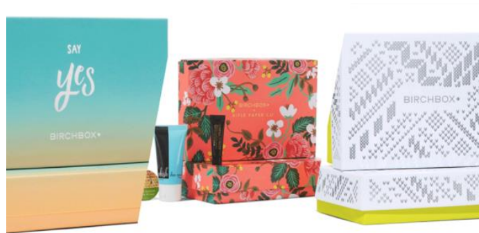
Slika 9: Primjer održive ambalaže tvrtke Birchbox