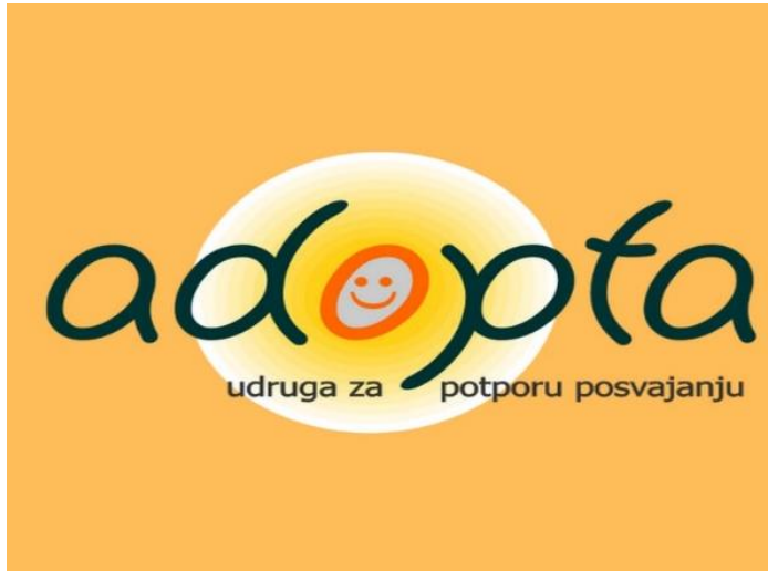
Slika 2. Projekt 'Centar posvojenja' 115