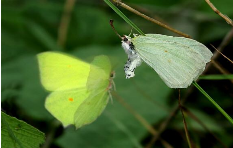
Slika 6. Ženka vrste Gonepteryx rhamni podiže zadak kako bi signalizirala odbijanje mužjaka.

prethodnog rituala. Većina leptira ostaje u kopulaciji sat vremena ili nešto duže, ali kod žučka ostaju u kopulaciji i do 17 dana (Web 8).