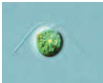
Slika 1. Jednostanična alga s dva biča ( Dunaliella sp. )