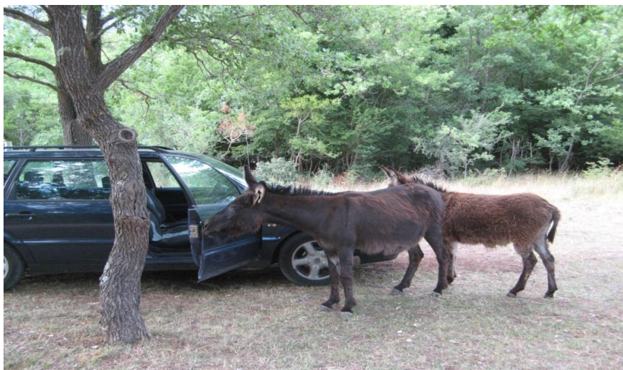
Slika 9. Automobil-tovar klopka

Postoji tzv. automobil-tovar klopka (Slika 9.) gdje je magarac privezan kraj auta na kojem su otvorena vrata. Magarac privlači obade ugljikovim dioksidom koji izdiše, oni ulijeću u auto, brzo zatvorimo vrata kad ih veći broj uleti unutra sjednemo u auto i hvatamo ih rukom.