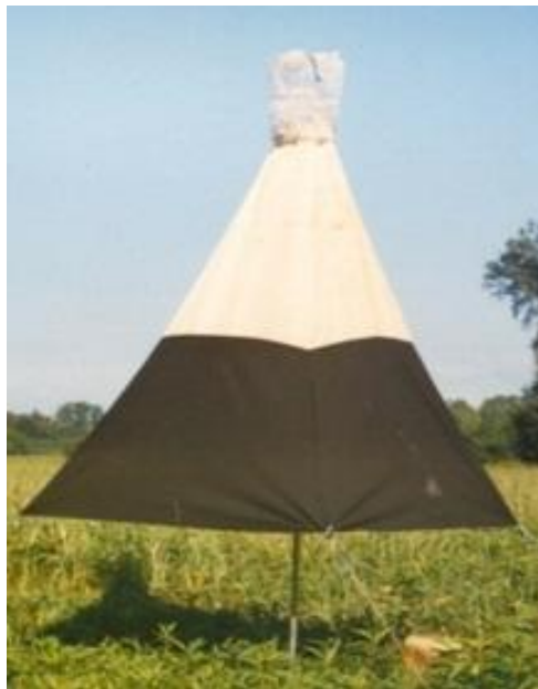
Slika 6. Manitoba klopka

Modificirana Manitoba klopka je ručne izrade, napravljena po nacrtu Hribara i suradnika 1991., godine. Ona je crno-bijele boje, izrađena od sintetičke tkanine (98% poliester, 2% viskoza). Osnovni dio klopke je sakupljački šator i sakupljačka kapa. Klopka je izrađena poput četverostrane piramide. Donji dio sakupljačkog šatora je crn, visine 80 cm, a gornji dio je bijele boje i također visok 80 cm. Dakle visina sakupljačkog šatora je 160 cm. Baza svake stranice sakupljačkog šatora je 110 cm, tako da je površina donjeg ulaznog otvora sakupljačkog dijela klopke (šatora) 120 \text{ cm}^2 , a on je postavljen 80 cm iznad tla (Kopi, 2006). Sakupljački dio klopke (šator) završava okruglim izlaznim otvorom promjera 20 cm, na koji se kao i kod Malezovih klopki postavlja sakupljačka kapa koja je za 2 cm veća od promjera izlaznog otvora, tako da se može lako postaviti i skinuti s vrha sakupljačkog dijela klopki (šatora) (Kopi,2006). Načinjena je od metalne konstrukcije u obliku lijevka te obložena prozirnom tkaninom bijele boje koja se na vrhu može odvezati prilikom pražnjenja klopke. Napravljena isto kao i kod Malezovih klopki. Nosač u koji se postavlja bočica s atraktantom postavljen je 30 cm ispod izlaznog otvora sakupljačkog dijela klopki. Klopka je pričvršćena pomoću noseće metalne konstrukcije koju čini metalna cijev u dva dijela, svaki visine 110 cm. Gornji dio metalne cijevi učvršćen je za gornji otvor sakupljačkog šatora dok je donji dio pričvršćen u tlu (Slika 6).