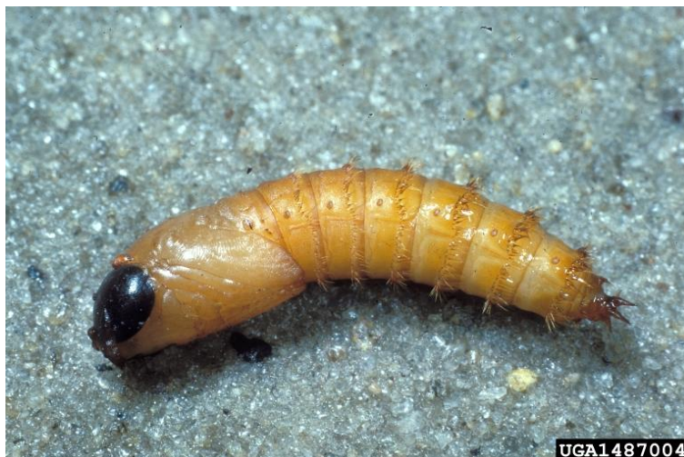
Slika 3. Kukuljica obada (Web 2)