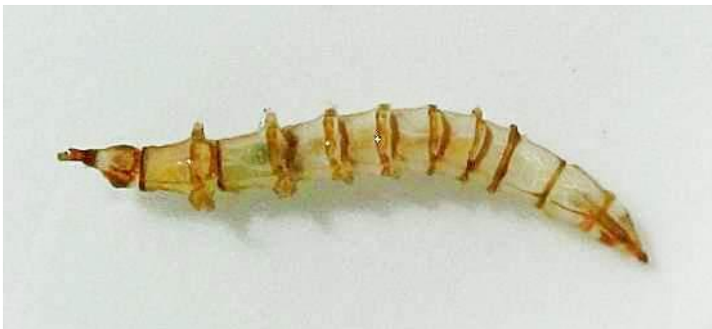
Slika 2. Ličinka obada (Web 1)

Obadi prolaze potpunu metamorfozu koja uključuje jaje, ličinku, kukuljicu i imago. Četiri do sedam dana nakon hranjenja krvnim obrokom ženka obada polaže jaja u blizini vodenih površina na listove ili stabljike različitih biljaka. Obadi polažu oko 400 do 1000 jaja većinom u cjelovitim hrpama, u obliku piramide ili okruglih pločica (Chvála i sur. 1997). Oblik, veličina i boja jaja ovisi o vrsti. Nakon osam do deset dana nakon polijeganja jaja, ako vremenski uvjeti to dozvole, iz jaja se razvijaju ličinke (Slika 2). One su vretenastog oblika sa zašiljenim krajevima te se sastoje od 12 kolutića i glave (Krčmar, 1998). Nakon 11 do 12 mjeseci iz ličinke se razvije kukuljica koja je slična kukuljici leptira i cilindričnog je oblika (Slika 3). Stadij kukuljice traje od 5 do 28 dana ovisno o temperaturi. Iz kukuljice se razvije odrasla jedinka imago (Slika 4), a nakon 2 do 3 sata sposobna je za let (Chvála i sur. 1997).