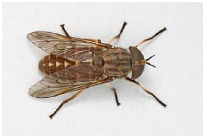
Slika 4. Imago obada (Web 3)

Mužjaci obada hrane se nektarom. Epidemiološki su značajne samo ženke koje se hrane krvnim obrokom prije svakog polaganja jaja. Takve ženke su anautogene (Krčmar i sur. 2002). Nakon trećeg polaganja jaja anautogene ženke ugibaju. Autogene ženke su one vrste koje se kao i mužjaci hrane nektarom prije svakog polaganja jaja. Nakon drugog polaganja jaja i ishrane nektarom autogene ženke ugibaju. Velike ženke napadaju izravno žrtvu, dok ženke manjih veličina kruže leteći oko žrtve neposredno prije uzimanja krvnog obroka. Hranjenjem ženke povećavaju 2 do 3 puta svoju tjelesnu težinu (Chvála i sur. 1997).