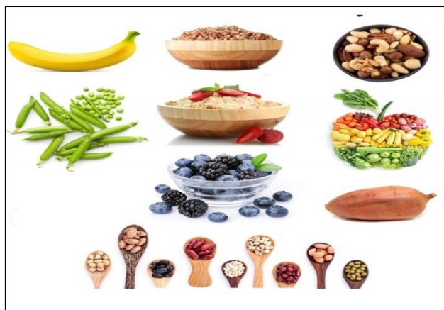
Slika 5. Složeni ugljikohidrati (Web 5.)