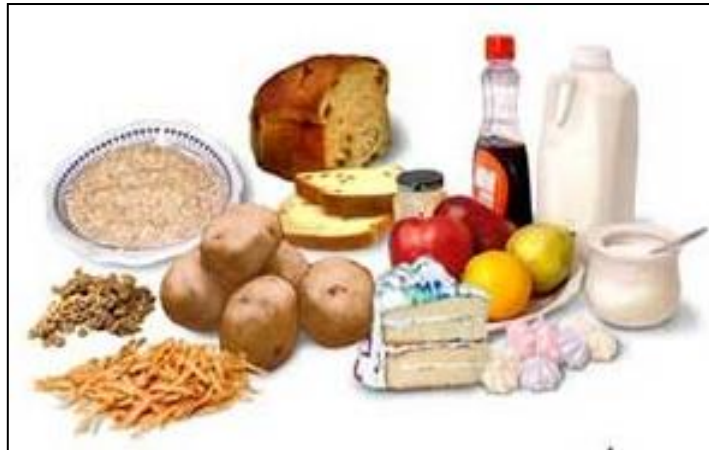
Slika 4. Jednostavni ugljikohidrati (Web 4.)