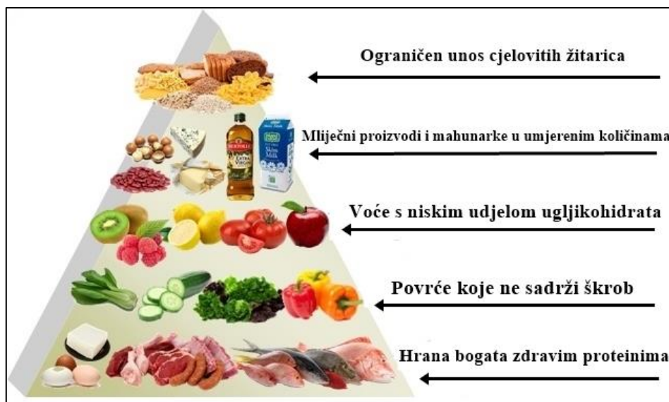
Slika 3. Piramida namirnica preporučena za prehranu s niskim udjelom ugljikohidrata (Web 3.)

Razlikujemo jednostavne i složene ugljikohidrate. Jednostavni ugljikohidrati su škrob i šećeri, lakše se probavljaju nakon kuhanja, a namirnice u kojima su najzastupljeniji su žitne pahuljice, riža, krumpir te brašno i proizvodi od brašna (Slika 4.). Složeni ugljikohidrati su vlaknaste tvari (Slika 5.), a nalaze se u povrću i voću, cjelovitim žitaricama te ubrzavaju odstranjivanje štetnih sastojaka iz organizma (Eliasson, 2006). Najviše štetni ugljikohidrati se nalaze u gaziranim pićima koja se sve više konzumiraju, koja ne sadrže gotovo ništa mikronutrijenata, stoga bi njihov unos trebalo smanjiti (Arvidsson-Lenner i sur., 2004).