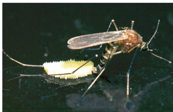
Slika 2. Ovipozicija ženke komarca

Otprilike dva do četiri dana nakon krvnog obroka, ženke polažu između pedeset i petsto jajašaca. Pri polaganju jajašaca ženke stoje na vodenoj površini tako da im stražnje noge zauzimaju V-oblik, a zatim se jajašca ispuštaju kroz genitalni otvor (Barr, 1958). Ovisno o vrsti jaja se polažu u nakupinama ili pojedinačno (Clements, 1992). Za razliku od navedenih, poplavni komarci, kao što su oni iz roda Aedes i Ochlerotatus , jaja ne polažu na vodenu površinu nego na tlo koje će kasnije biti poplavljeno (Slika 2). Supstrat na koji polažu jaja mora biti dovoljno vlažan budući da su ona iznimno osjetljiva na gubitke vode prije nego se formira voštani sloj serozne kutikule. Kako bi se izlegle ličinke naknadno je potrebna određena količina vode (Horsfall i sur., 1973), a poželjno je i da se u blizini nalaze odrasli komarci koji bi štitili ličinke od možebitnih predatora (Clements, 1992). Ovakav način ovipozicije ima prednost nad uobičajenim u razdobljima kada vode na nekom području trenutno nema, ali će je kroz neko vrijeme biti.