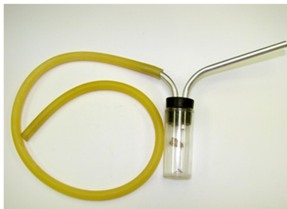
Slika 10. Aspirator

Uzorkovanje odraslih jedinki vrši se pomoću čovjek-aspirator metode. Pomoću aspiratora (Slika 11) se prikupljaju komarci koji slete na prednji dio tijela čovjeka. Ukoliko unutar 15 minuta broj komaraca premašuje 15, potrebno je intervenirati adulticidnim tretmanima.