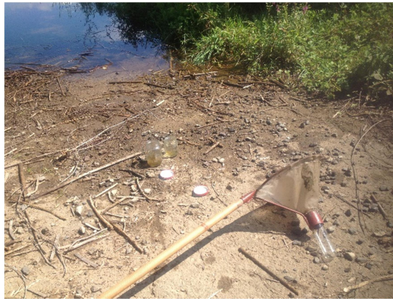
Slika 9. Leglo komaraca i mrežica za ličinke

Na malim vodenim površinama cijeli uzorak profiltrira se kroz mrežicu u staklenu bočicu. Kako je uzorka na ovim leglima malo, kao standard se koristi pola litre uzorka.