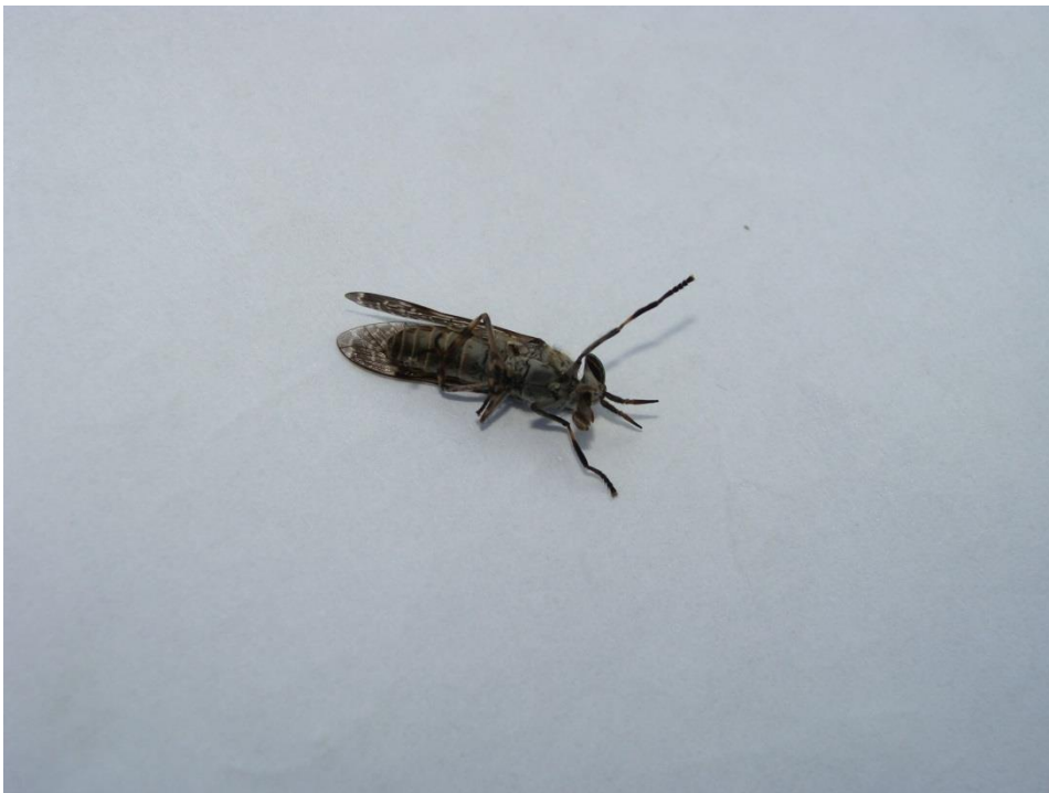
Slika 7. Haematopota pluvialis (Papuk)

Haematopota pluvialis (Kišni obad) (Slika 7.)