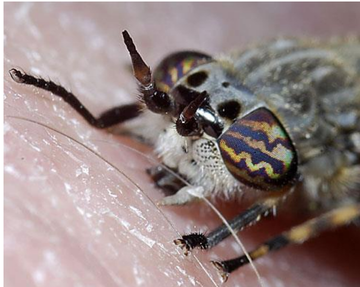
Slika 8. Haematopota pluvialis, ženka (Web 4)

Ženka Haematopota pluvialis (Slika 8.) ima izrazito oblikovane dlakave oči - očne pruge se protežu preko većine oka. (Web 4)