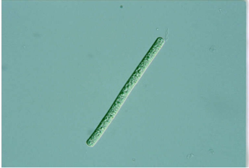
Slika 6. Vrsta roda Oscillatoria koji je vrlo često pronađen u Bizovačkim toplicama.