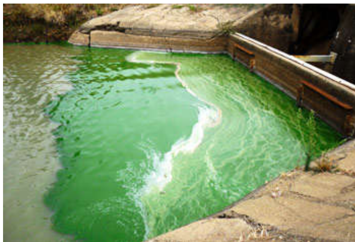
Slika 4. Cvjetanje cijanobakterija.