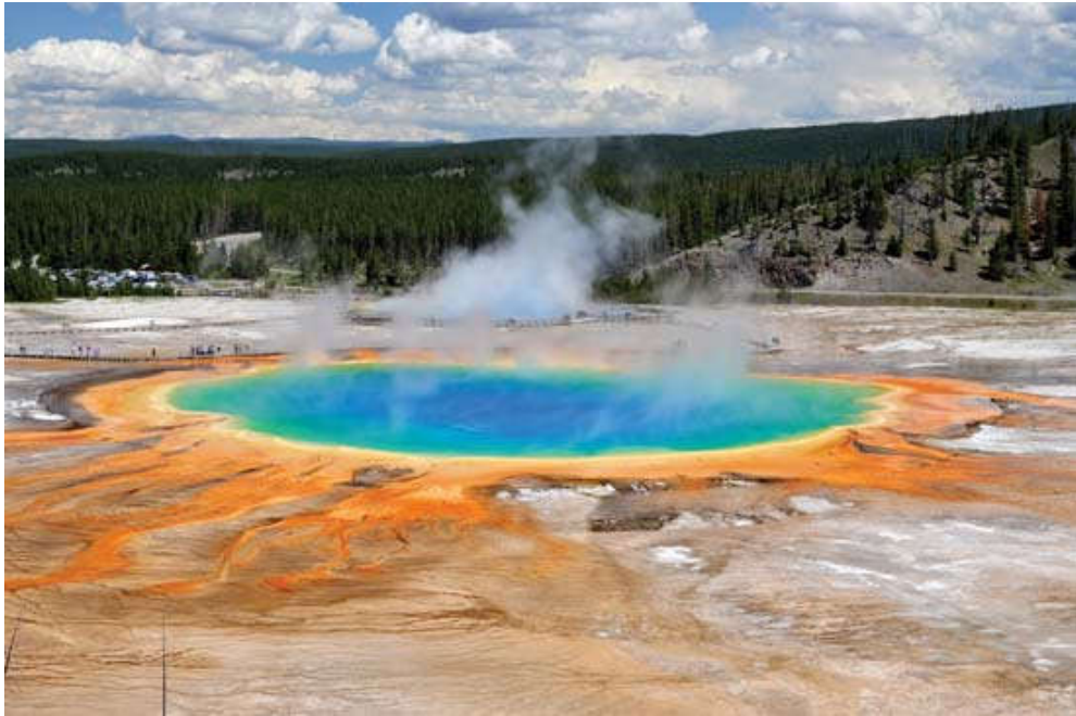
Slika 5. Prikaz termalnog izvora nacionalnog parka Yellowstone u SAD-u, poznat po geotermalnim pojavama.

°C (Jana, 1973). Termalni izvori u Indiji u kojima su utvrđeni ovi rezultati imali su gotovo konstantnu temperaturu, a pH vode iznosio je između 7.4 i 9.2. Ujedno ih karakteriziraju parametri poput odsutnosti nitrita i CO 2 te tragova nitrata, kao i prisutnost planktona koja je varirala pri višim i nižim temperaturama (Jana, 1973).