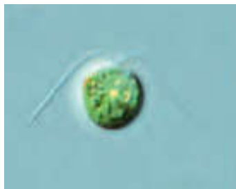
Slika 1. Jednostanična alga s dva biča ( Dunaliella sp. )