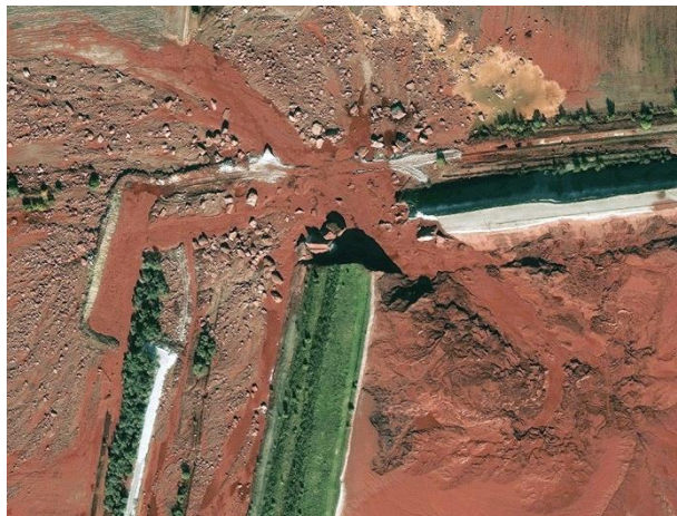
Slika 1: Satelitski snimak izlaska crvenog mulja kroz oštećeni bazen (Web 1)

Crveni mulj korišten u ovome radu potječe sa dvije lokacije. Jedan uzorak potječe iz Obrovca, propale tvornice aluminija "Jadral", a drugi potječe iz Mađarske, grada Ajka, u kojem se 2010. dogodilo pucanje bazena sa pohranjenim crvenim muljem i lužinom, što je izazvalo ekološku katastrofu.