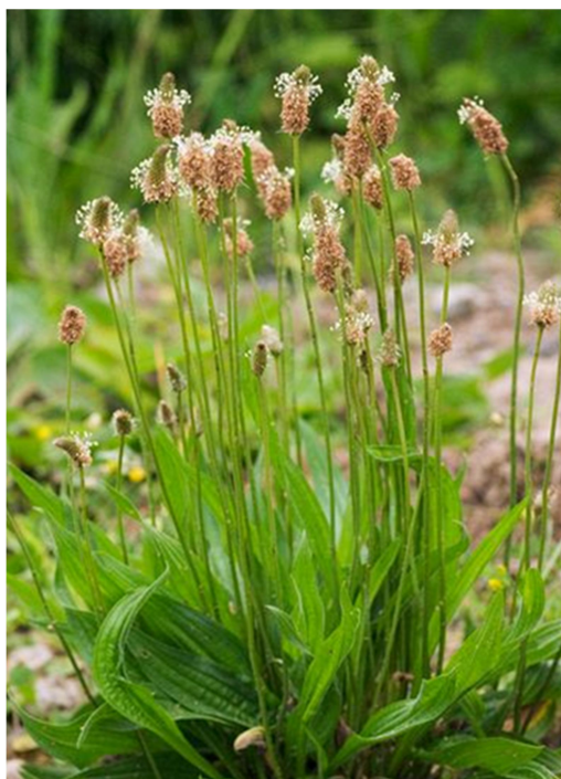
Slika 9. Plantago lanceolata L. (Izvor: web 9)

Uskolisni trputac je višegodišnja zeljasta biljka. Ima kratki podanak i jak korijen, a može narasti do 40 cm u visinu. Listovi biljke su prizemni, dugi, lancetastog oblika i cjelovitog ili nazubljenog ruba. Cvjetovi uskolisnog trputca su sitni, dvospolni, pravilni, bjelkasti i skupljeni u guste, klasaste cvatove. Plod je tobolac (Domac, 1989; Šarić, 1989; Moore, 2009). Uskolisni trputac cvate od svibnja do rujna (Dubravec i Dubravec, 2001).