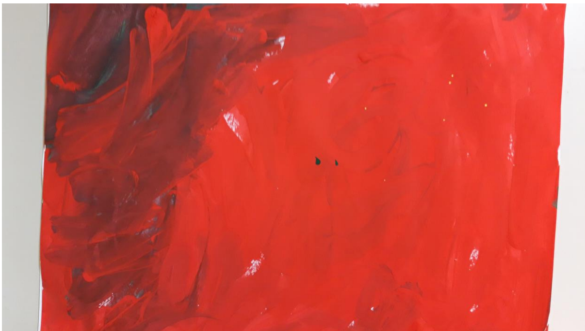
Slika 9., dječji crtež, 4 god.

Crtež pripada četverogodišnjem dječaku. Na dječjim crtežima crvena boja ima snažan utjecaj. Crvena kao boja krvi simbol je entuzijazma i energije. Rad nam sugerira da dijete koje crvenu boju koristi dosljedno, jest dominantan i ekstrovertiran te voli biti u središtu pažnje.