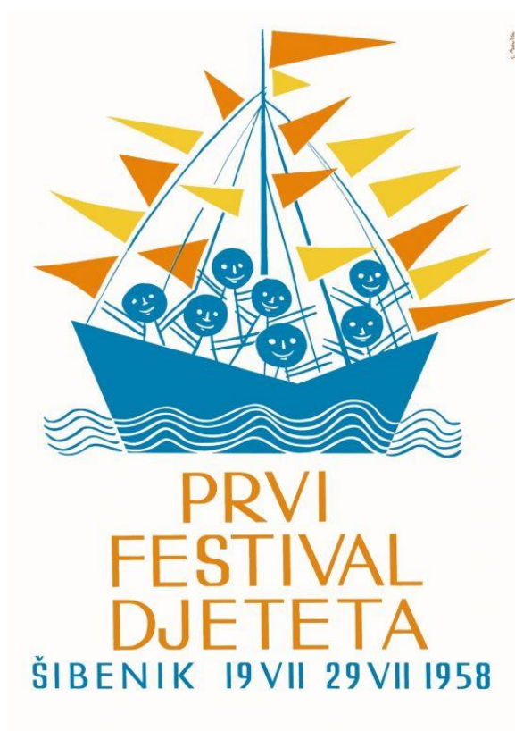
Slika 1. Prikaz plakata za 1. festival djeteta u Šibeniku 1958. godine, autora Steve Biničkog.

Nesumnjivu posebnost šibenske kulture i svojevrsni zaštitni znak grada već dugi niz godina predstavlja Međunarodni dječji festival koji je u svijetu prepoznat kao jedinstvena kulturna manifestacija. Festival, koji je prvi put održan 1958. godine, nastao je kao ostvarenje inicijative i angažmana nekolicine zaljubljenika u dječju umjetnost i umjetnost za djecu. Iako je od svojih početaka pa sve do 1990. godine nosio predznak „jugoslavenski“, festival je vrlo brzo prešao granice tadašnje države te je postao događaj od međunarodnoga značaja, uključivši u svoj program sudionike sa svih kontinenata. Njegova je posebnost što su se u jedno spojile tri nerazdružive komponente: djeca, festival i gradska sredina, kako bi kroz kulturnu manifestaciju pokazale ono najbolje od dječjeg stvaralaštva i najbolje od stvaralaštva odraslih za djecu. Festival kroz svoja događanja spaja brojne umjetnosti poput dramske, lutkarske, glazbeno-scenske, filmske, literarne i likovne.