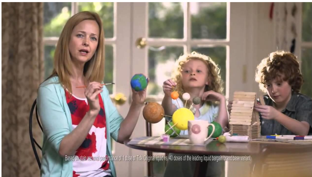
Fotografija 3. Youtube, 2013. (Preuzeto: 17. srpnja 2019.)

Primjerice, reklama za Ariel kapsule prikazuje žene kako plešu i pjevaju dok peru odjeću na ruke, reklama za Tide deterdžent u kojoj žena s djecom sjedi za stolom i radi školski projekt te ističe kako je napustila svoj posao kako bi bila više s djecom, reklama za Snickers u kojoj je muškarac prikazan u tijelu isfrustrirane žene, a društvo mu govori da pojede čokoladicu jer se ponaša kao diva itd.